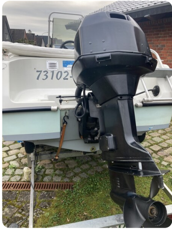
Big Fish 470 msp768487 15