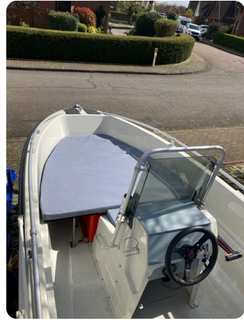
Big Fish 470 msp768487 8