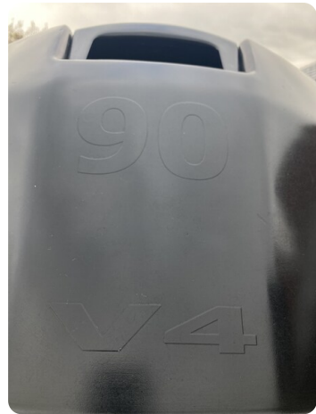
Big Fish 470 msp768487 14