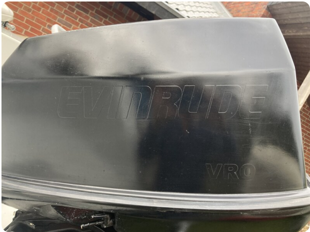
Big Fish 470 msp768487 13