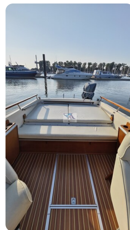
Windy 25 MIRAGE msp790159 42