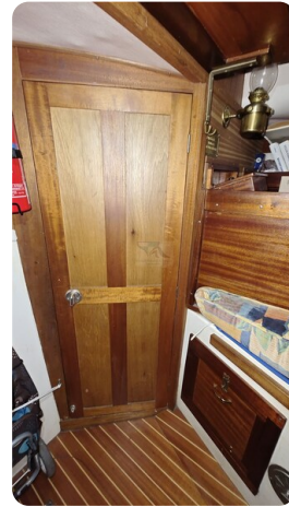
Westerly 36 Conway ANTIMALOCHE 46