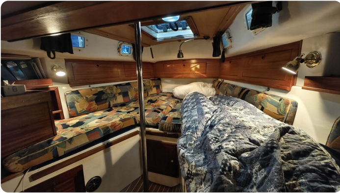
Westerly 36 Conway ANTIMALOCHE 37