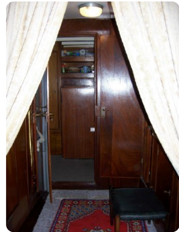
Lührsen Kutteryacht 21,50m msp256650 14