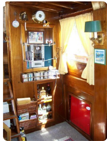
Lührsen Kutteryacht 21,50m msp256650 22