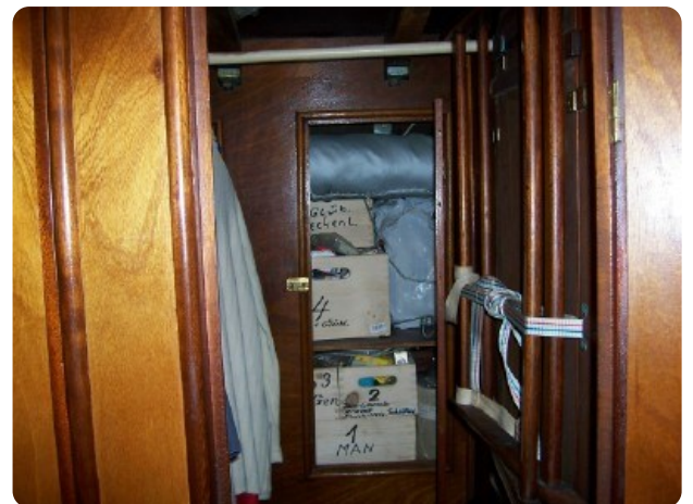
Lührsen Kutteryacht 21,50m msp256650 18