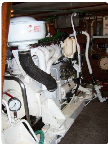
Lührsen Kutteryacht 21,50m msp256650 17