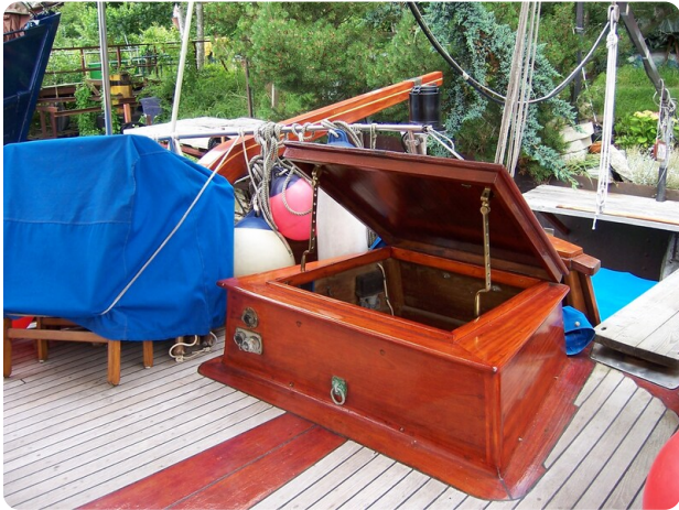
Lührsen Kutteryacht 21,50m msp256650 9