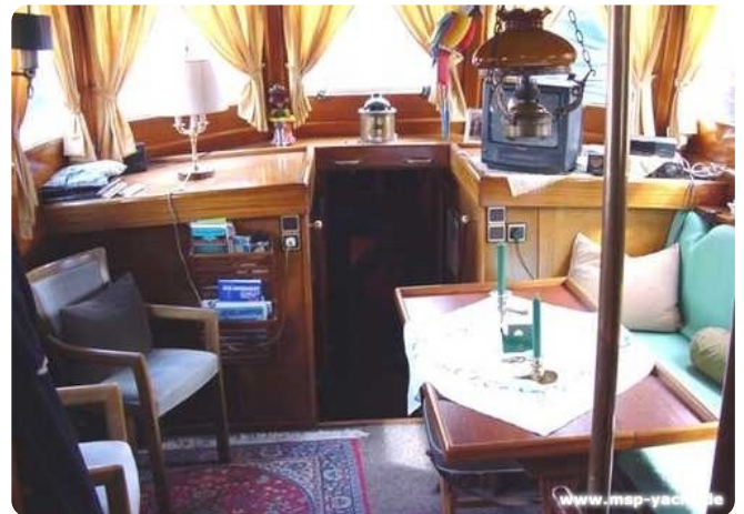
Lühsen Kutteryacht 21,50m msp256650 3