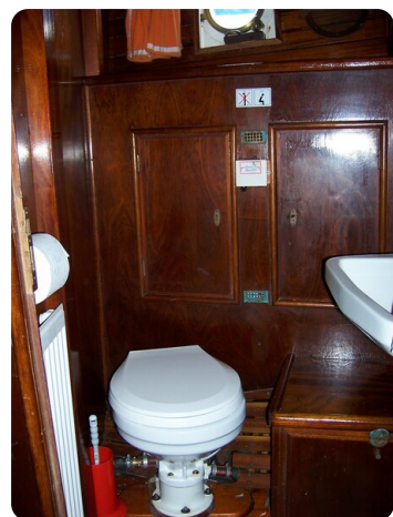
Lührsen Kutteryacht 21,50m msp256650 24