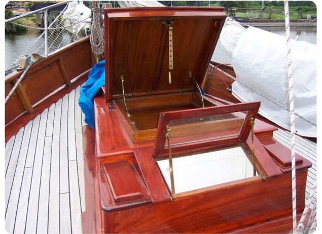
Lührsen Kutteryacht 21,50m msp256650 10