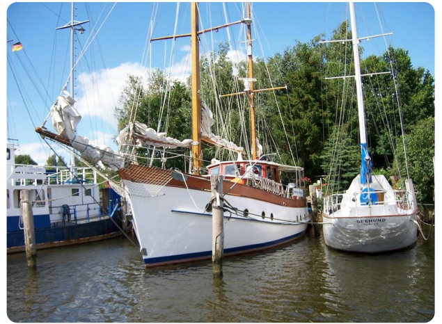
Lührsen Kutteryacht 21,50m msp256650 7