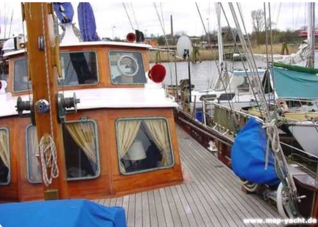
Lühsen Kutteryacht 21,50m msp256650 2