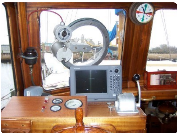
Lührsen Kutteryacht 21,50m msp256650 23