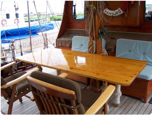
Lührsen Kutteryacht 21,50m msp256650 6