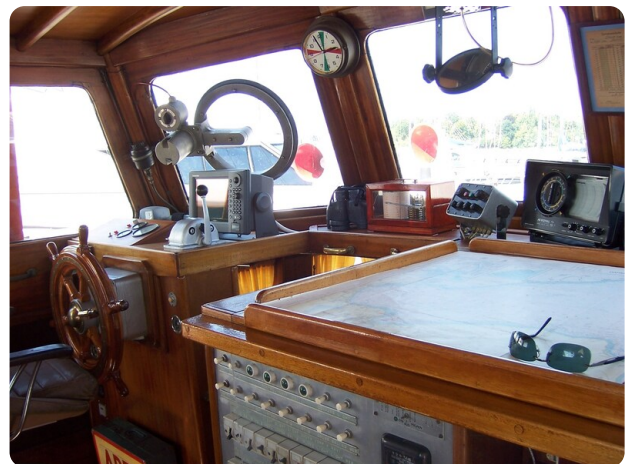
Lührsen Kutteryacht 21,50m msp256650 12