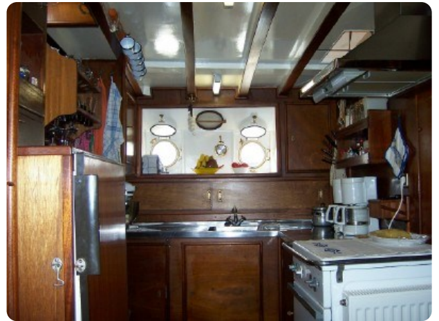
Lührsen Kutteryacht 21,50m msp256650 20