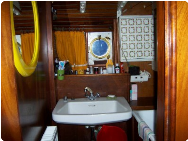
Lührsen Kutteryacht 21,50m msp256650 13