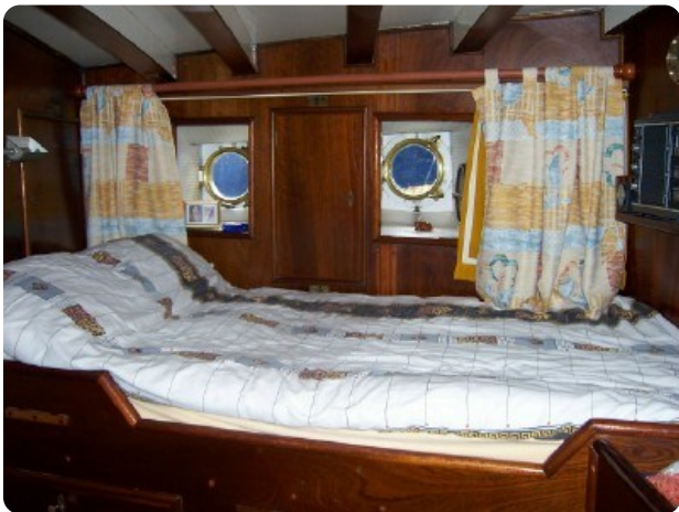
Lührsen Kutteryacht 21,50m msp256650 15