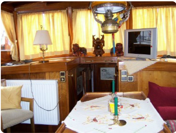
Lührsen Kutteryacht 21,50m msp256650 21