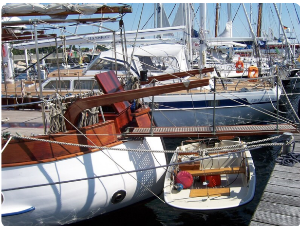
Lührsen Kutteryacht 21,50m msp256650 11