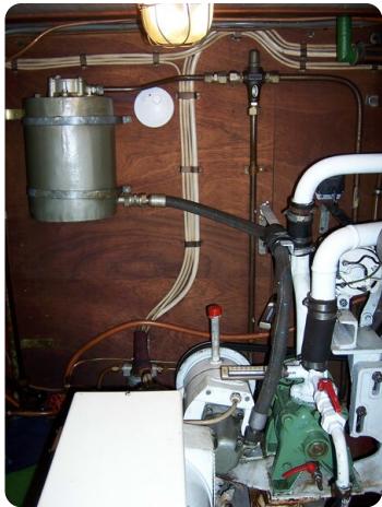
Lührsen Kutteryacht 21,50m msp256650 19