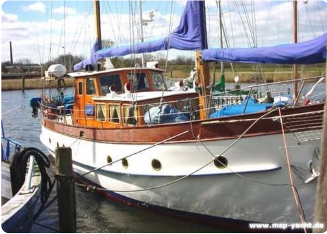
Lühsen Kutteryacht 21,50m msp256650 1