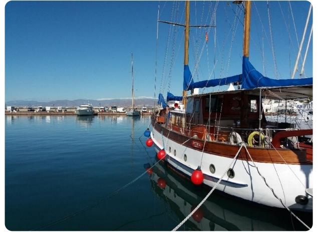
Sera Nevada Hintergrund