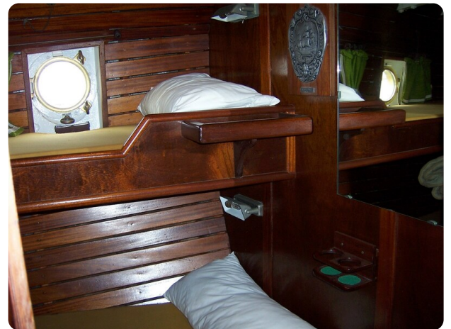
Lührsen Kutteryacht 21,50m msp256650 16