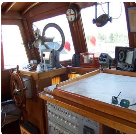
Lühsen Kutteryacht 21,50m msp256650 4