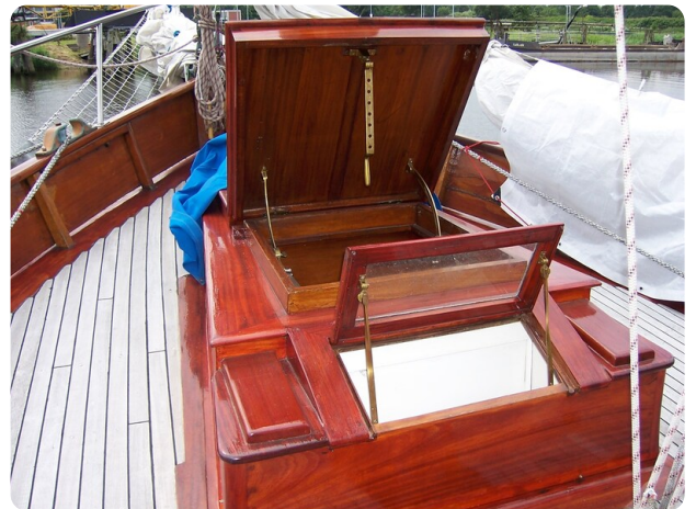
Lührsen Kutteryacht 21,50m msp256650 10