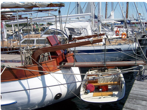
Lührsen Kutteryacht 21,50m msp256650 11