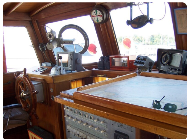
Lührsen Kutteryacht 21,50m msp256650 12