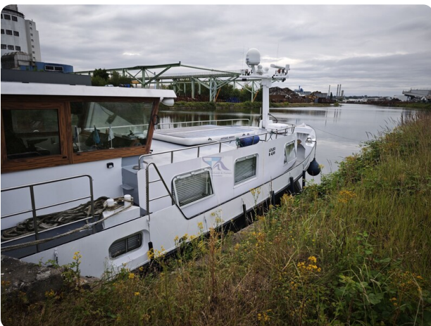
MY GINO 2