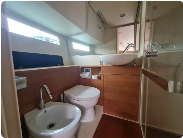
Vismara Bwave (2)