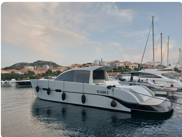
Vismara Bwave profile1