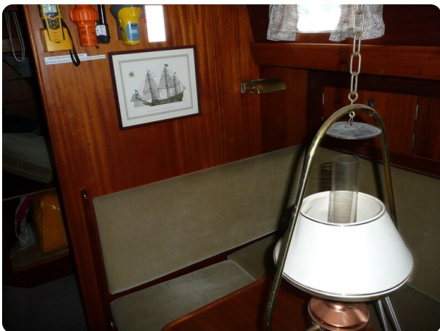
Vindö 50 msp269542 10