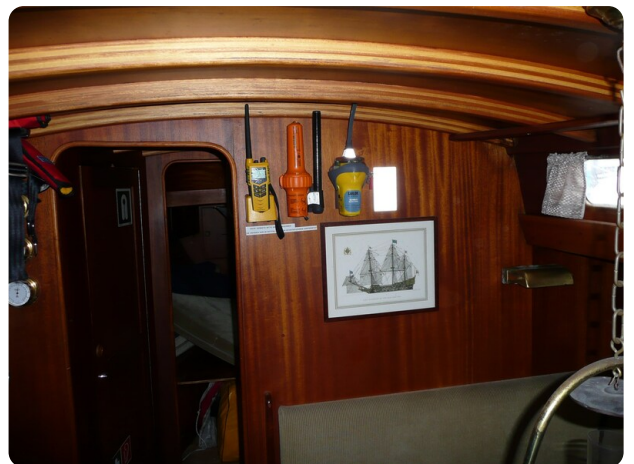
Vindö 50 msp269542 11