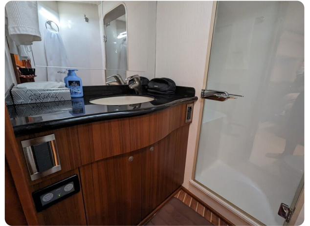
Viking 54 Convertible bathroom