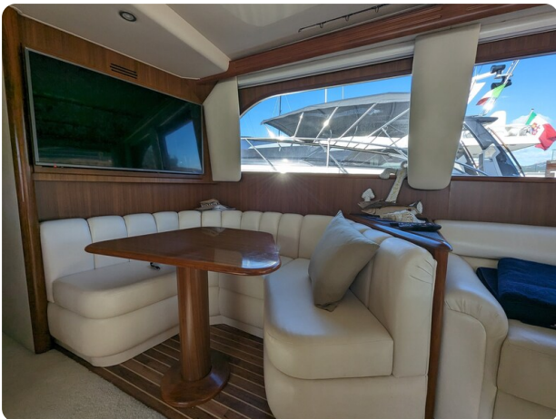
Viking 54 Convertible dinette detail