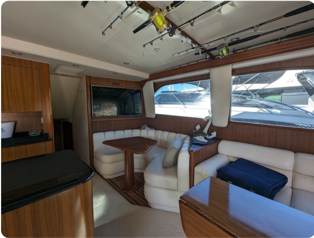
Viking 54 Convertible salon dinette