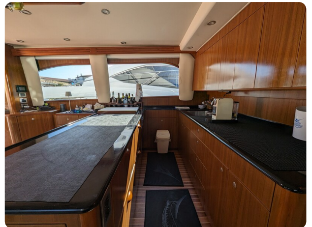
Viking 54 Convertible galley