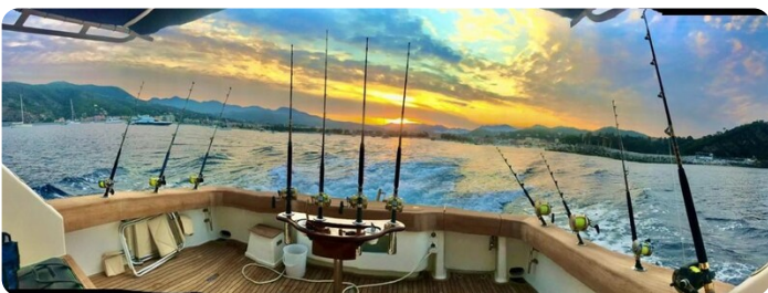
Viking 54 fishing