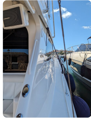
Viking 54 Convertible sideways