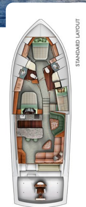
Viking 54 layout