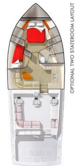
Viking 45' Open layout