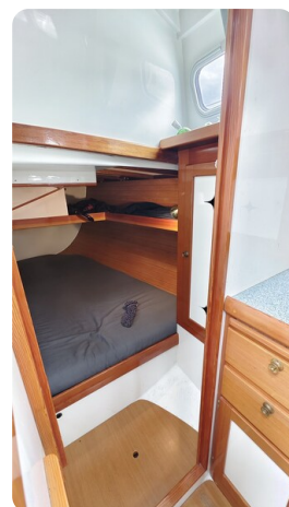
Helena 35 23