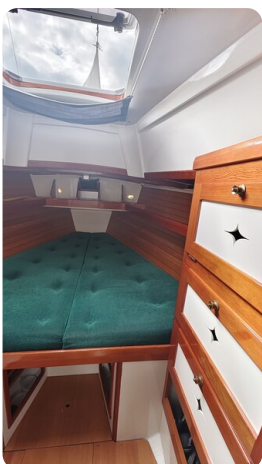
Helena 35 4