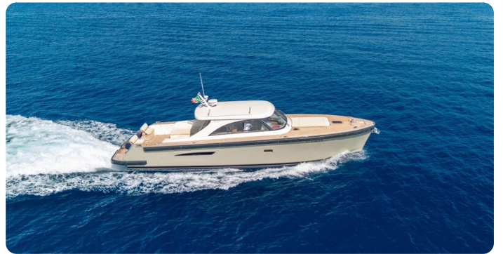
Toy Tender cruising