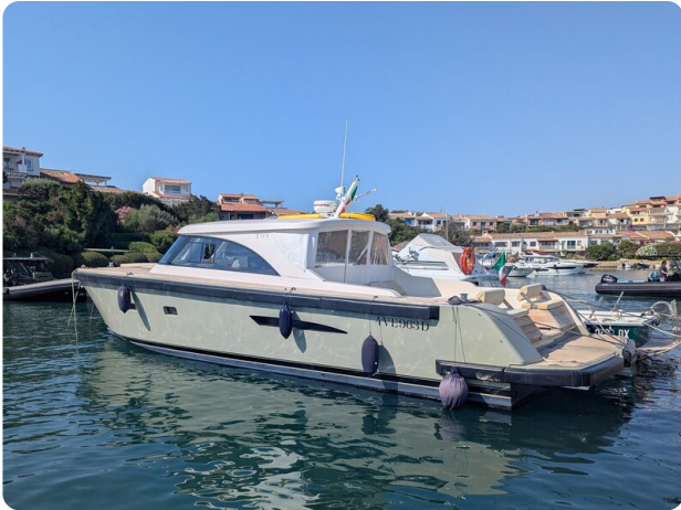
Toy Tender 47 profile