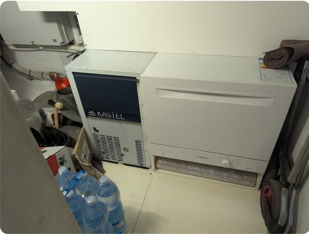
Toy Tender 47 mid storage