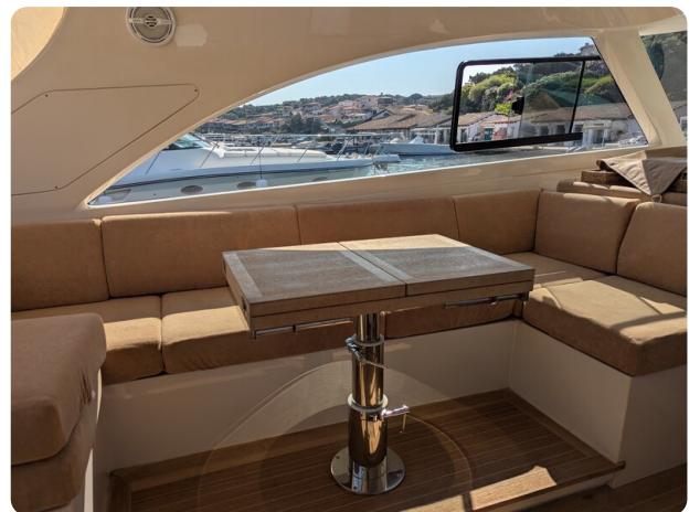
Toy Tender 47 cockpit dinette