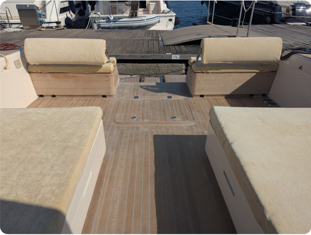
Toy Tender 47 cockpit detail