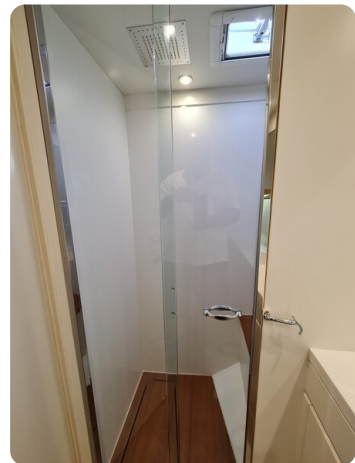
Toy Tender 47, shower