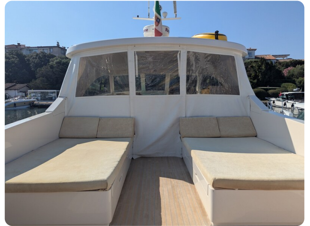
Toy Tender 47 cockpit sunpad