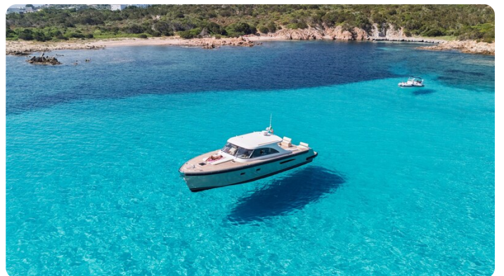
Toy Tender aerial view