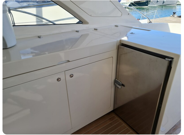
Toy Tender 47, galley