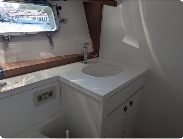
Toy Tender 47 guest bathroom