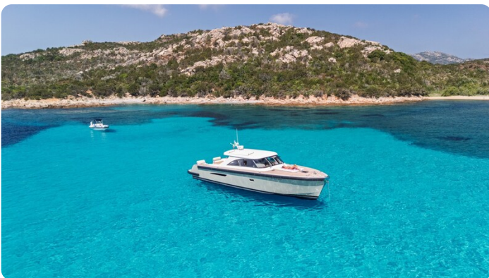
Toy Tender aerial 2