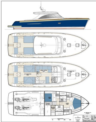
Toy Tender LAYOUT TT03