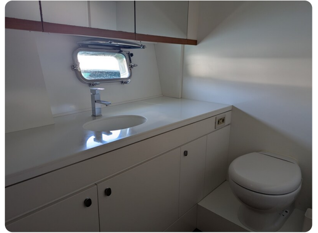
Toy Tender 47 owner's bathroom