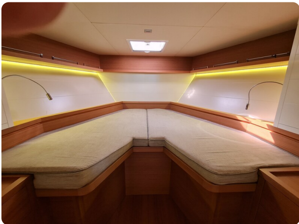
Toy Tender 47, master cabin