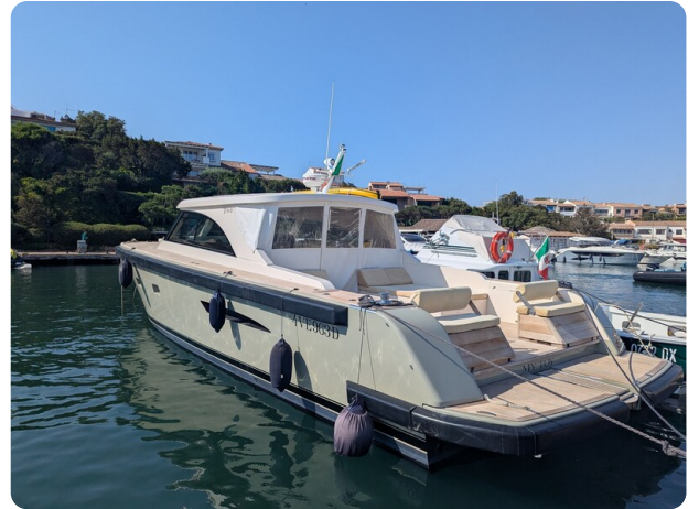
Toy Tender 47 aft profile