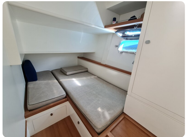
Toy Tender 47, guest cabin