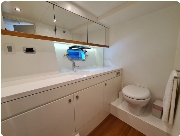
Toy Tender 47, bathroom