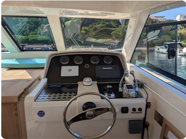
Toy Tender 47 helm