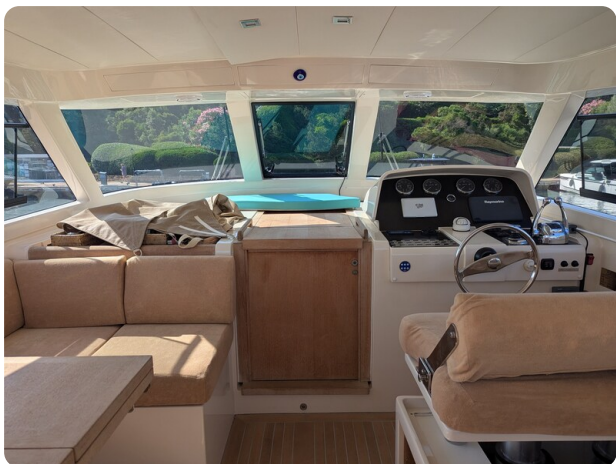
Toy Tender 47 helm station view