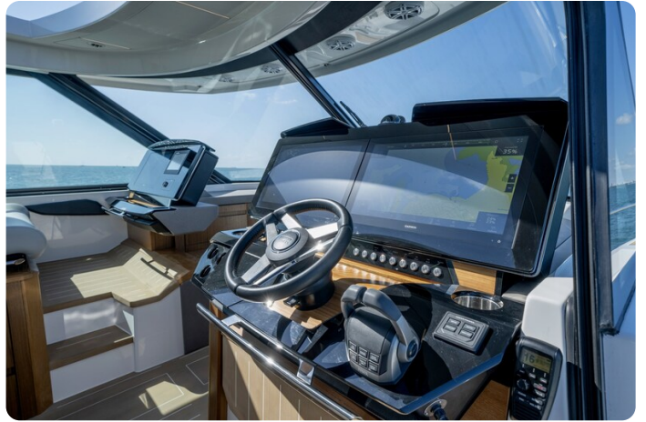
Tiara EX60 helm