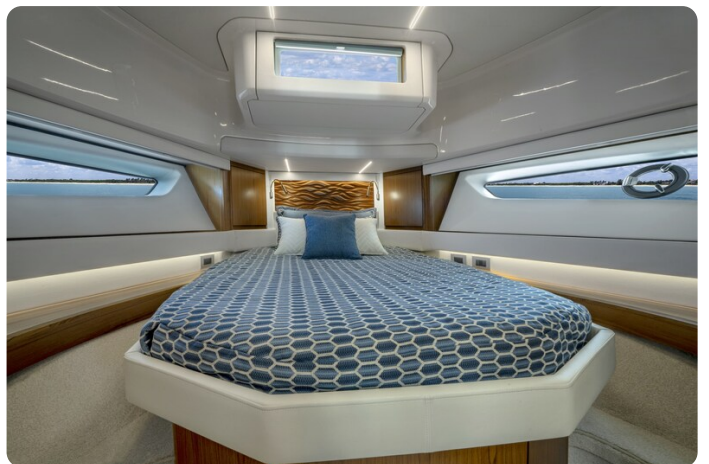
Tiara EX60 Vip cabin