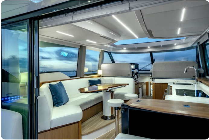
Tiara EX60 salon view