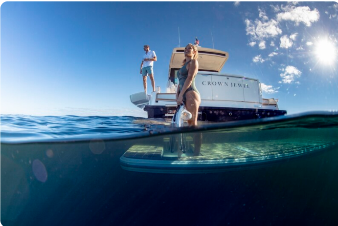
Tiara EX60 lifestyle