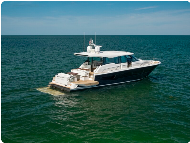
Tiara EX60 aft profile