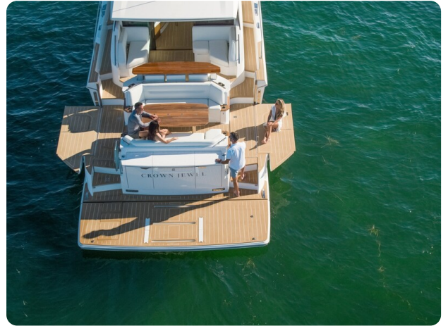
Tiara EX60 terraces