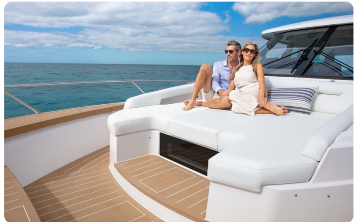
Tiara EX60 detail