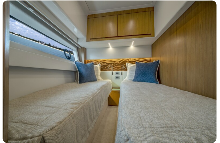
Tiara EX60 guest cabin