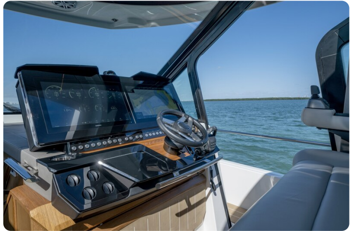
Tiara EX60 helm station