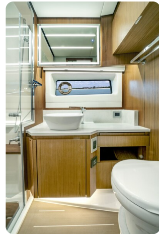
Tiara EX60 bathroom