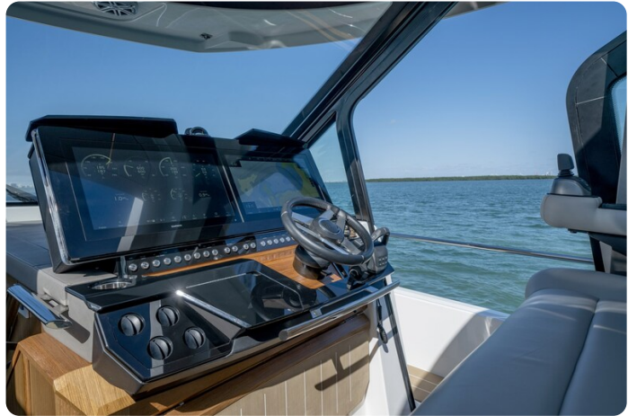
Tiara EX60 helm station