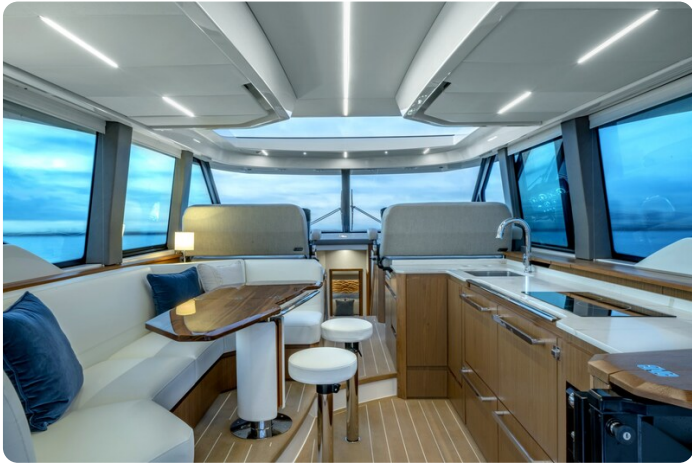
Tiara EX60 salon