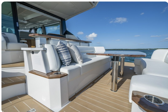
Tiara EX60 cockpit dinette