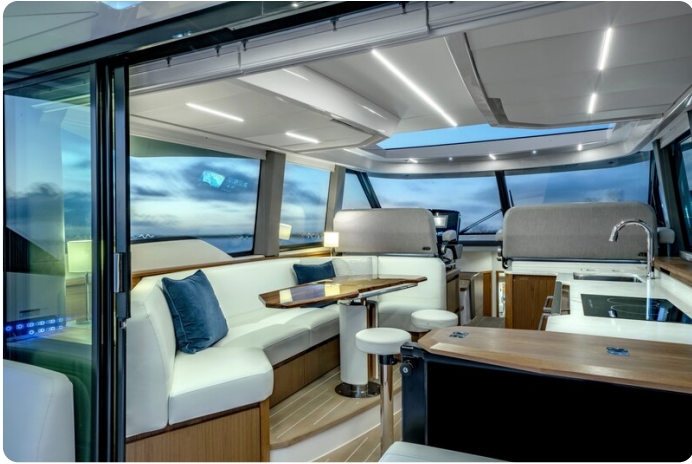
Tiara EX60 salon view