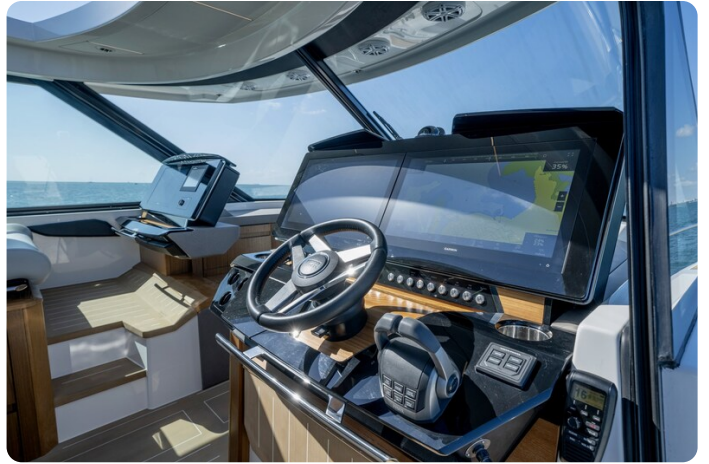
Tiara EX60 helm