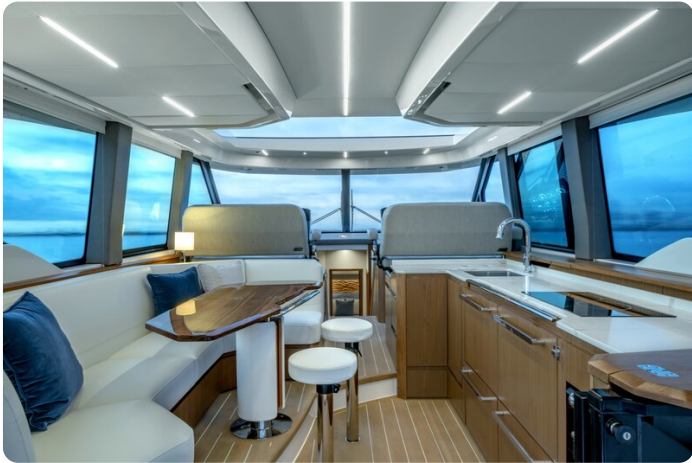
Tiara EX60 salon