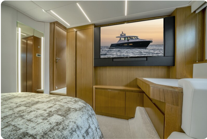
Tiara EX60 cabin detail