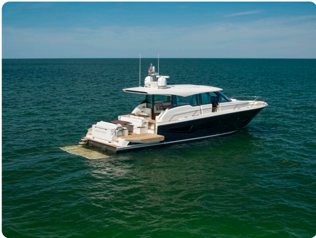
Tiara EX60 aft profile