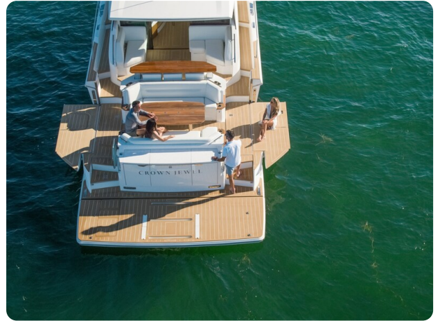
Tiara EX60 terraces