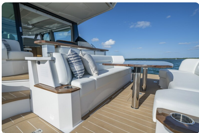
Tiara EX60 cockpit dinette