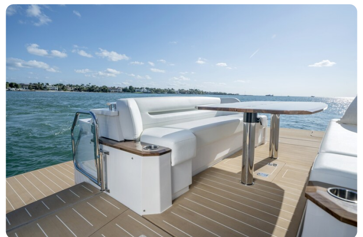
Tiara EX60 aft lounge