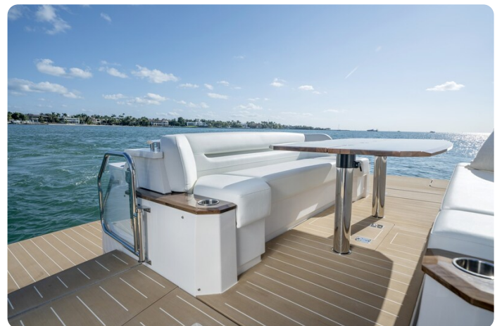
Tiara EX60 aft lounge