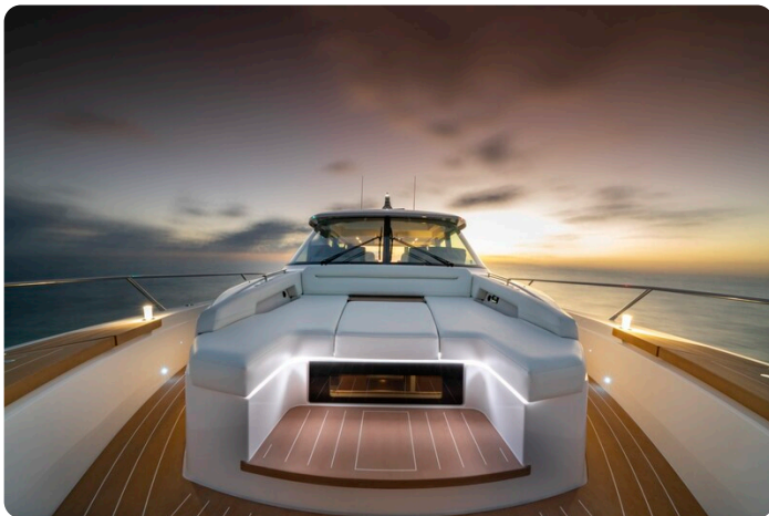
Tiara EX60 bow detail