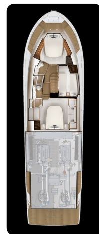
Tiara EX 60 lower layout