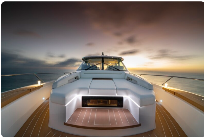
Tiara EX60 bow detail