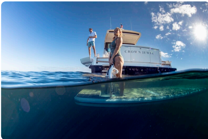
Tiara EX60 lifestyle