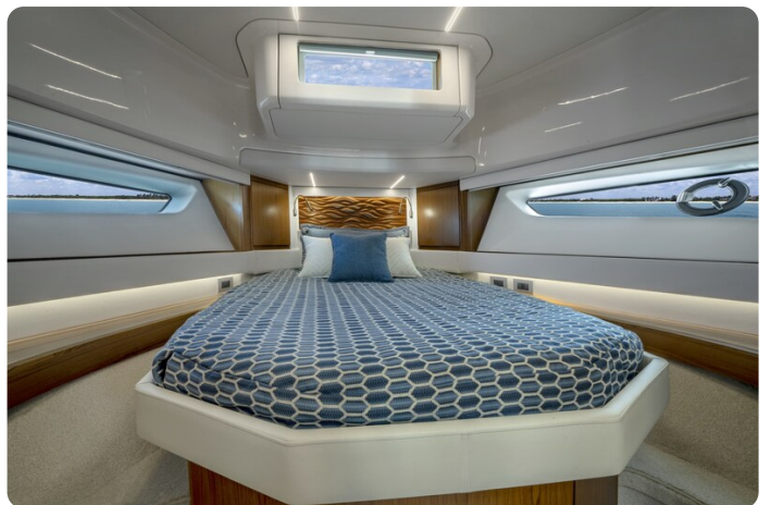
Tiara EX60 Vip cabin