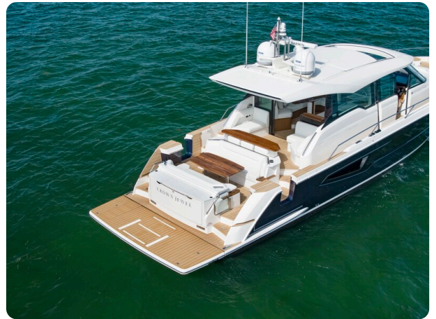
Tiara EX60 aft view