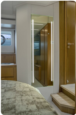
Tiara EX60 details