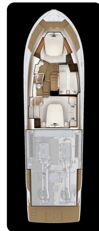
Tiara EX 60 lower layout