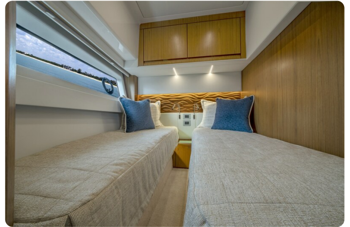
Tiara EX60 guest cabin