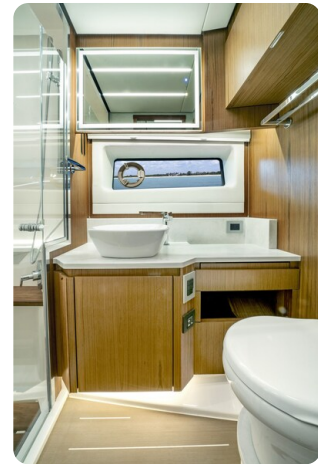
Tiara EX60 bathroom