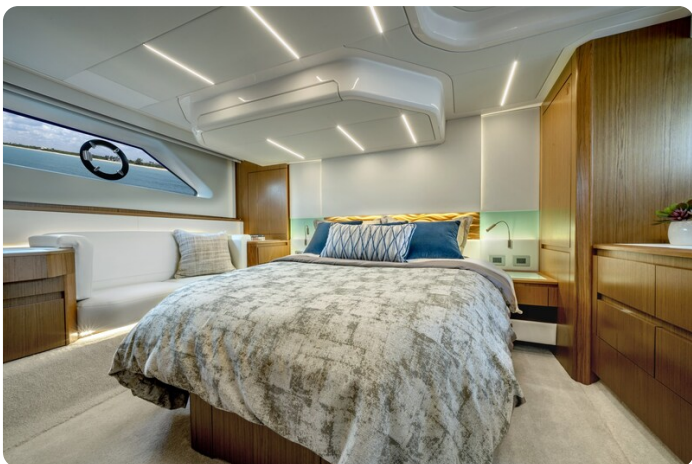
Tiara EX60 owner's cabin