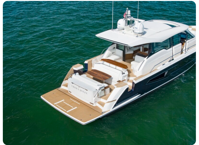
Tiara EX60 aft view