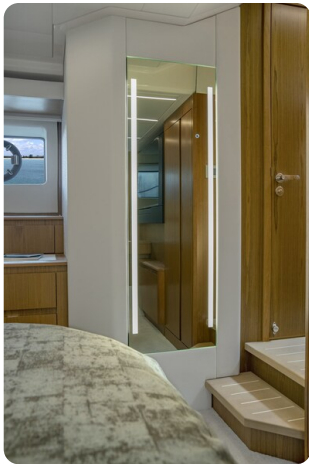
Tiara EX60 details