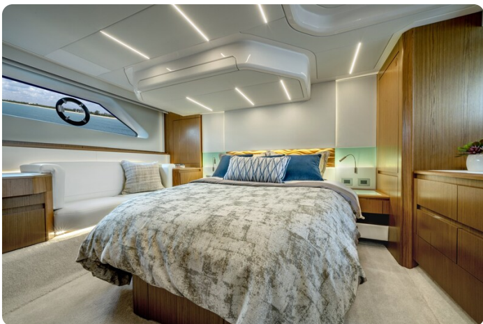
Tiara EX60 owner's cabin