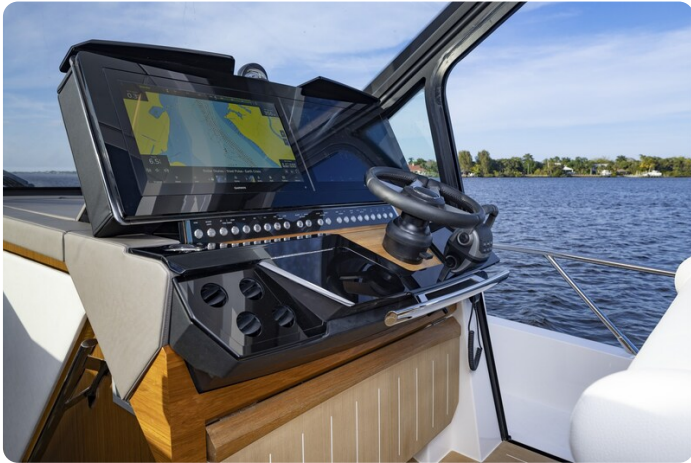
Tiara EX54 helm station