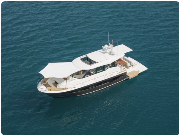
Tiara EX54 anchored