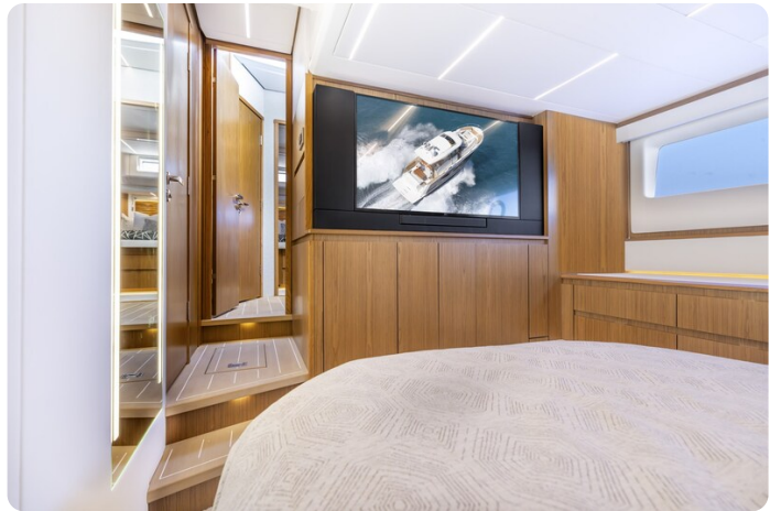
Tiara EX54 owner's cabin detail