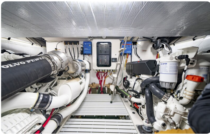
Tiara EX54 engine room