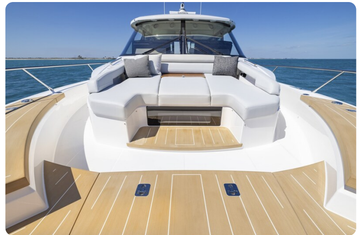
Tiara EX54 bow deck