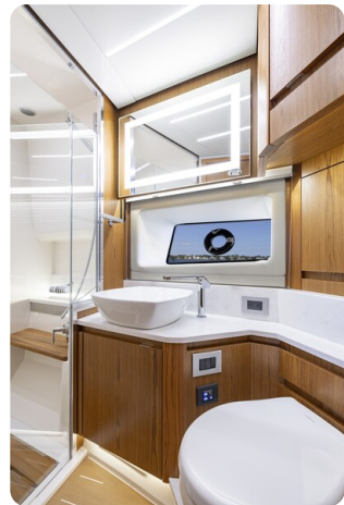
Tiara EX54 bathroom