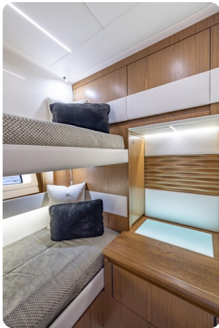
Tiara EX54 guest cabin