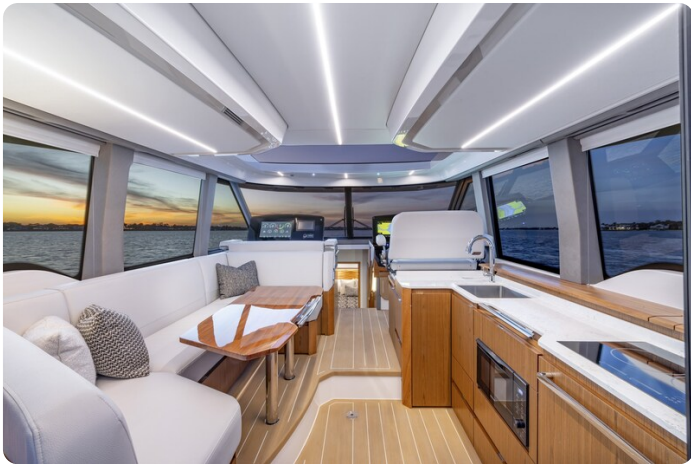
Tiara EX54 salon