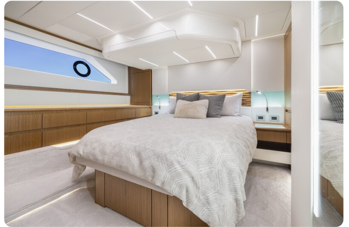
Tiara EX54 owner's cabin