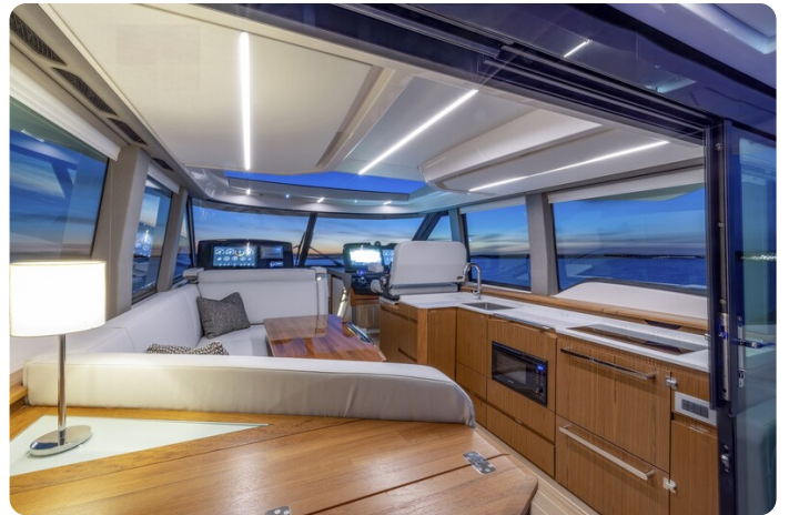
Tiara EX54 galley