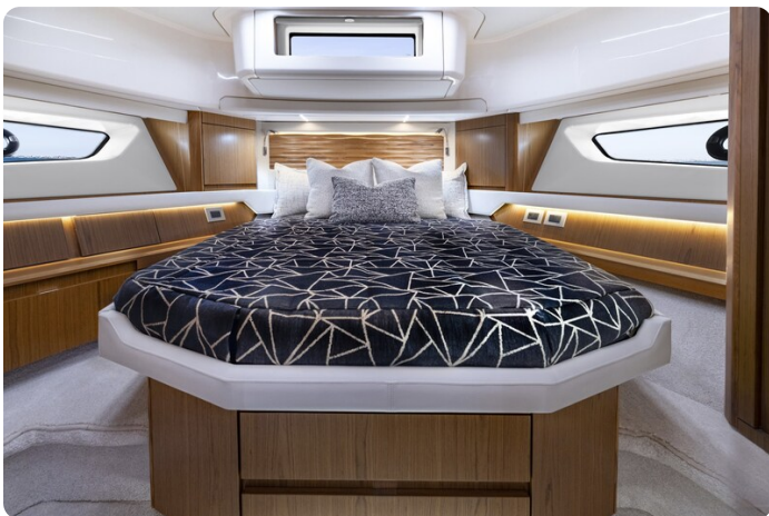
Tiara EX54 VIP cabin