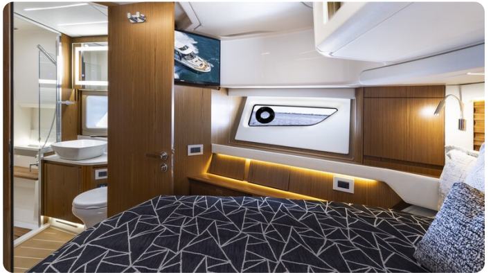
Tiara EX54 Vip cabin detail