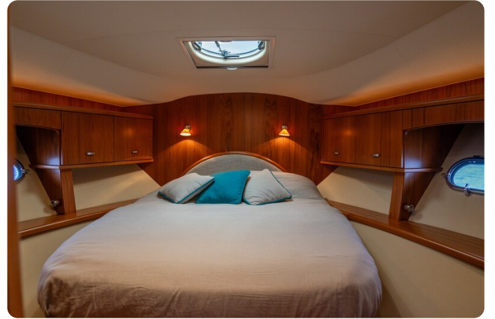
{1} Vip cabin