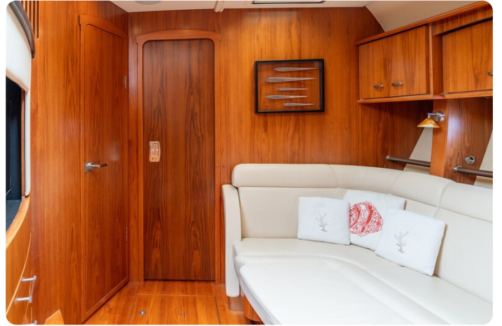
{1} Lower convertible dinette