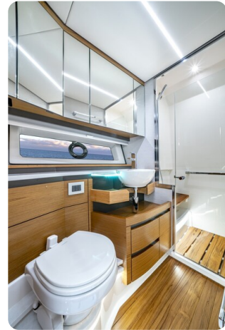
Tiara 48LE head and shower