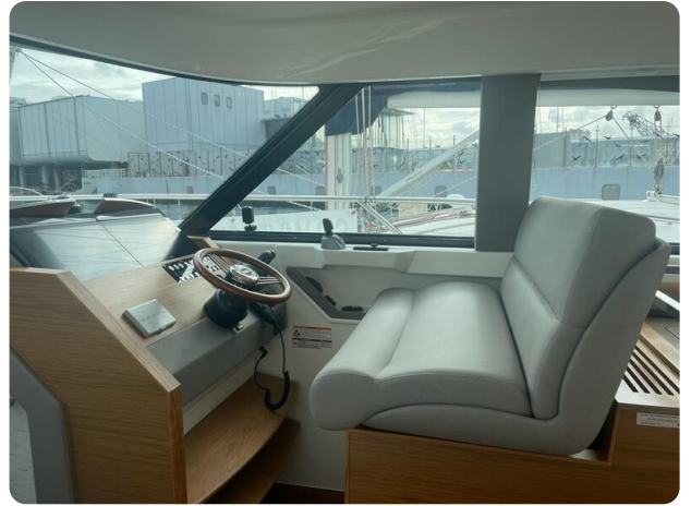
{1} Helm station