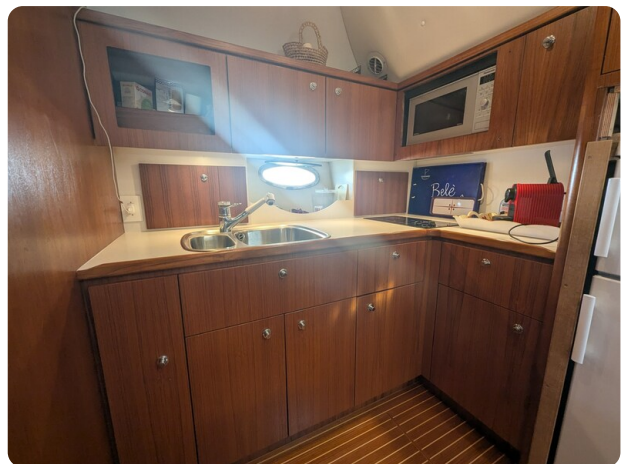
Tiara 4100 Open galley