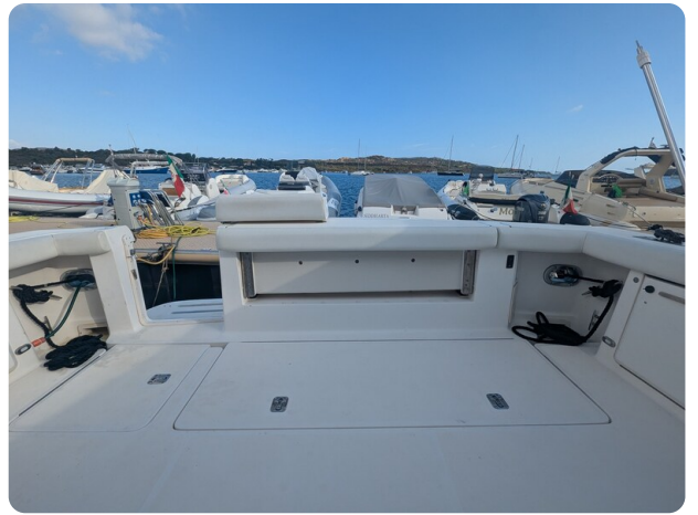
Tiara 4100 Open cockpit