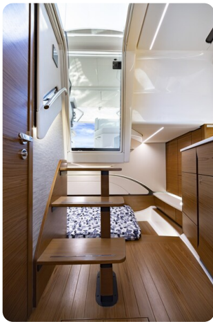
{1} Lower deck stairs