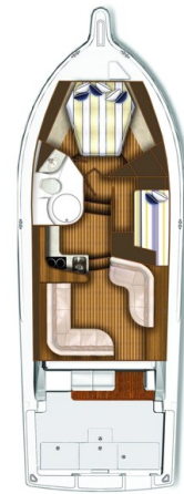
Tiara 3900 Convertible layout