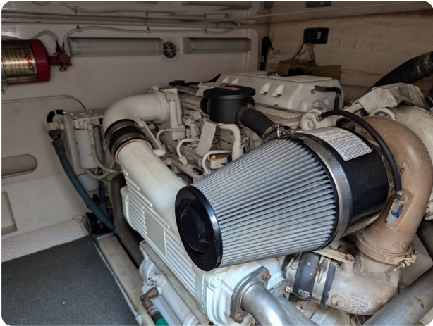
Tiara 3900 Conv. engine detail