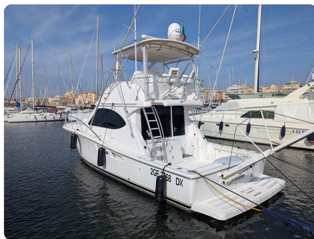
Tiara 3900 Conv. aft profile