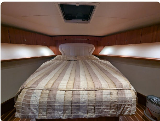
Tiara 3900 Conv. master cabin