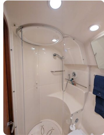
Tiara 3900 Conv. shower stall