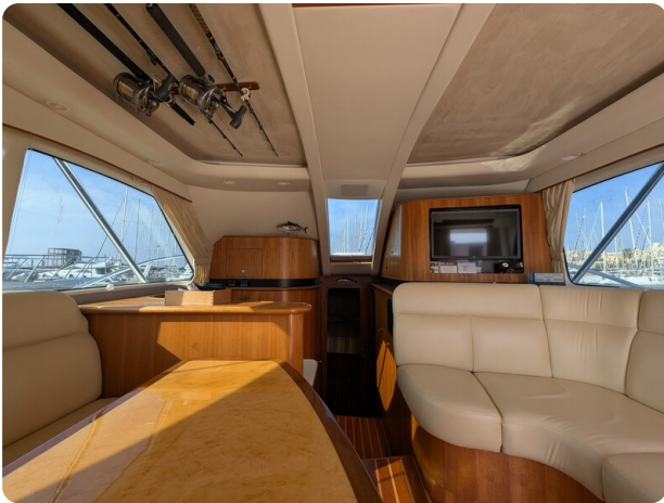
Tiara 3900 Conv. salon view