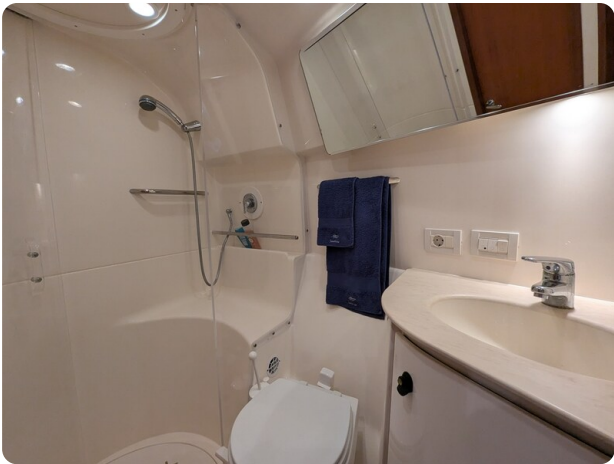
Tiara 3900 Conv. bathroom