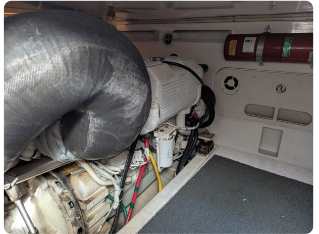
Tiara 3900 Conv. engine details