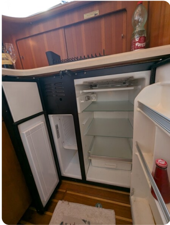
Tiara 3900 Conv. Galley fridge