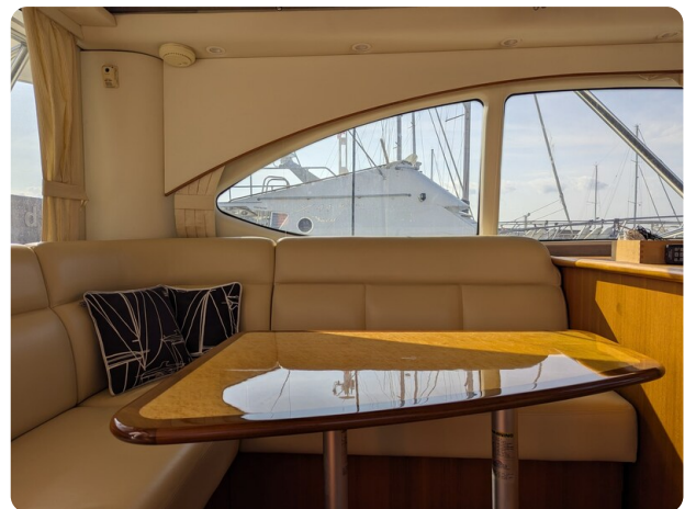
Tiara 3900 Conv. dinette