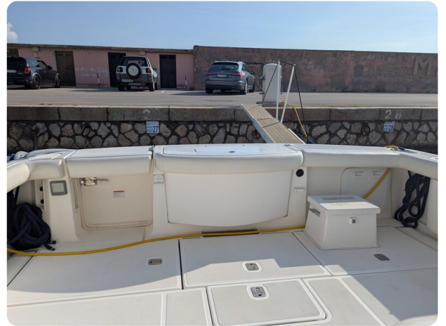
Tiara 3900 Conv. cockpit