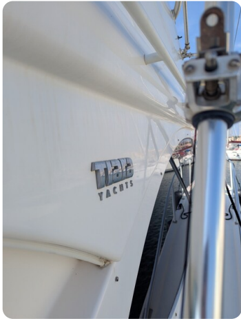
Tiara 3900 Conv. details