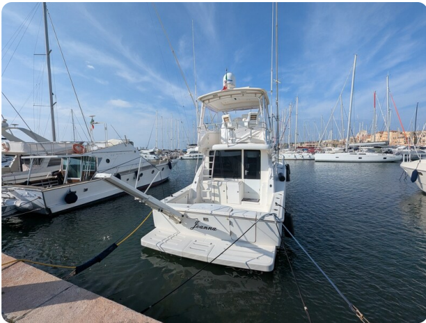
Tiara 3900 Conv. stern view