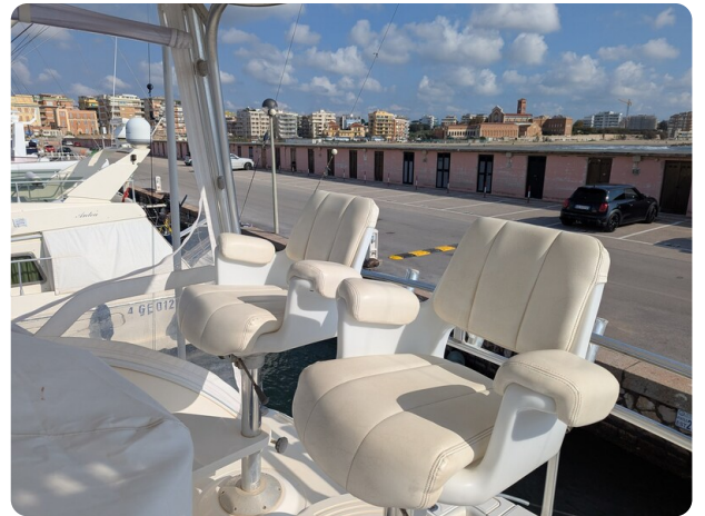
Tiara 3900 Conv. Fly seats