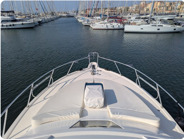
Tiara 3900 Conv. bow sunpad