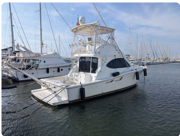
Tiara 3900 Conv. profile