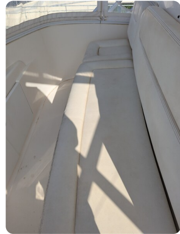
Tiara 3900 Conv. Fly dinette