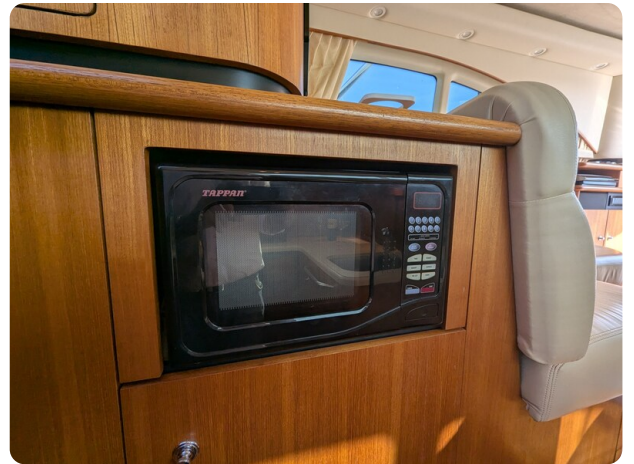
Tiara 3900 Conv. Galley detail