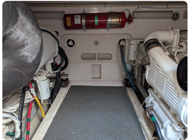
Tiara 3900 Conv. engine room