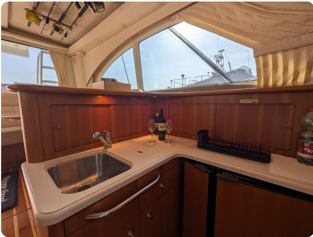
Tiara 3900 Conv. galley