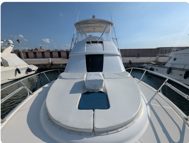
Tiara 3900 Conv. bow deck