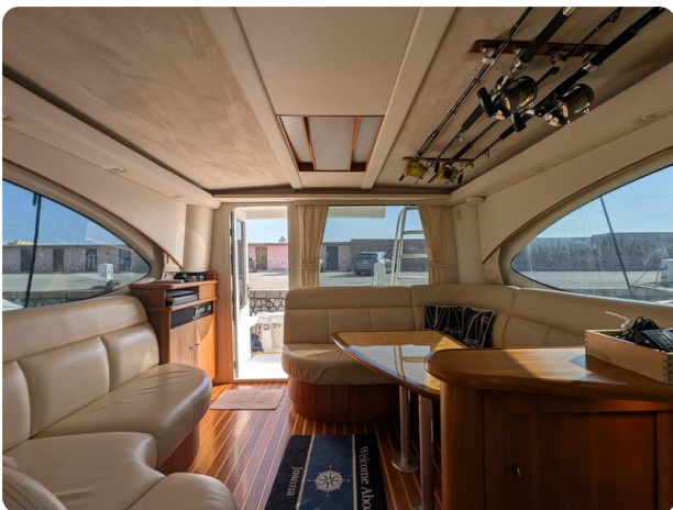
Tiara 3900 Conv. salon to aft