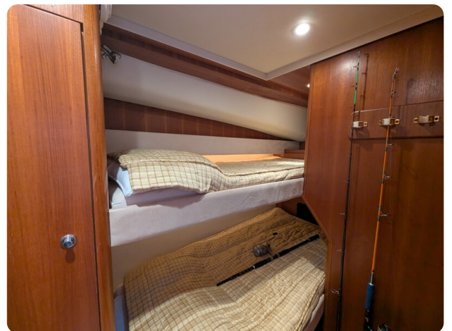
Tiara 3900 Conv. guest cabin