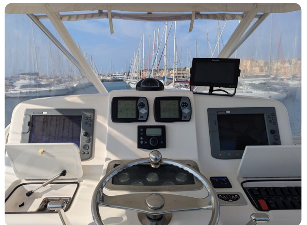
Tiara 3900 Conv. Helm station