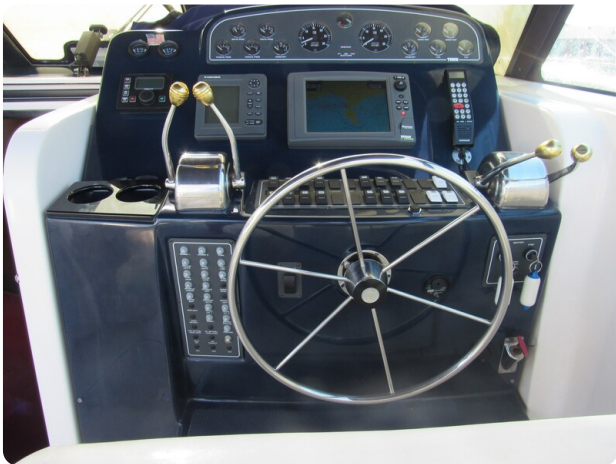
Tiara 3800 Open, helm