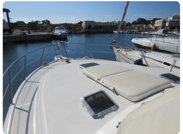
Tiara 3800 Open Bow Sunpad