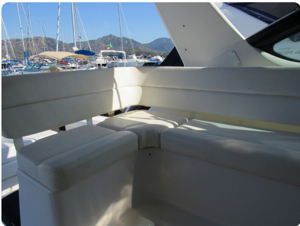
Tiara 3800 Open, cockpit lounge