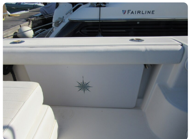
Tiara 3800 Open, cockpit detail