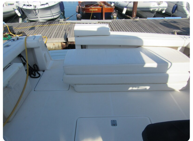
Tiara 3800 Open, cockpit with sunpads