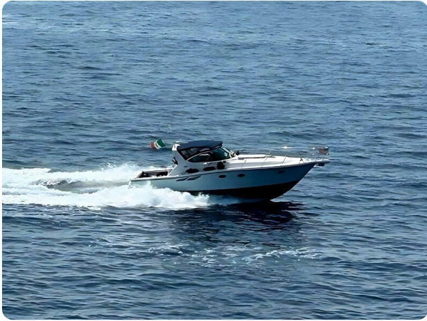
Tiara 3800 Open Cruising