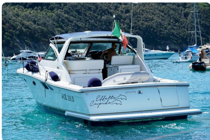
Tiara 3800 Open Effetto Cupido