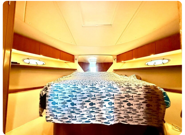
Tiara 3800 Open Cabin