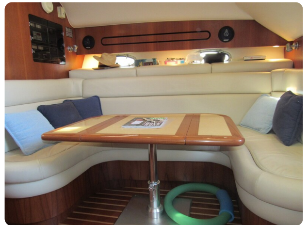
Tiara 3800 Open, dinette