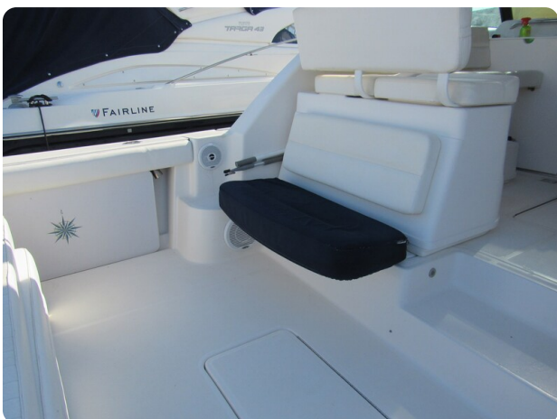
Tiara 3800 Open, cockpit aft seat