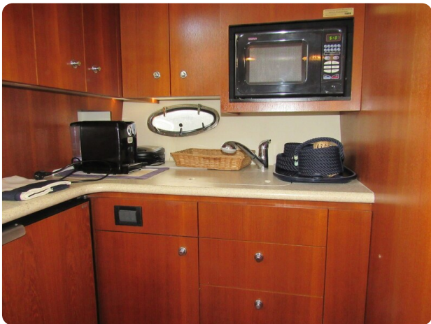
Tiara 3800 Open, galley