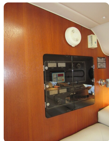
Tiara 3800 Open, electrical panel