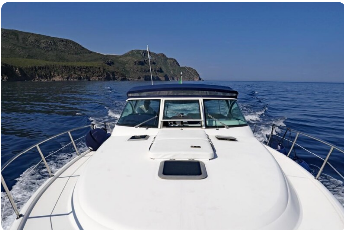
Tiara 3800 Open Bow