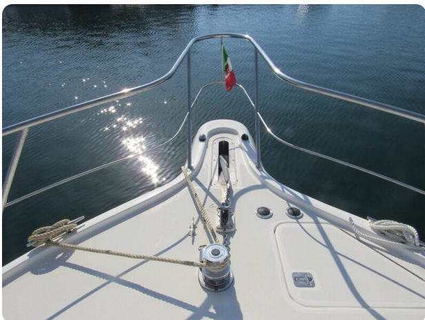
Tiara 3800 Open, bow pulpit