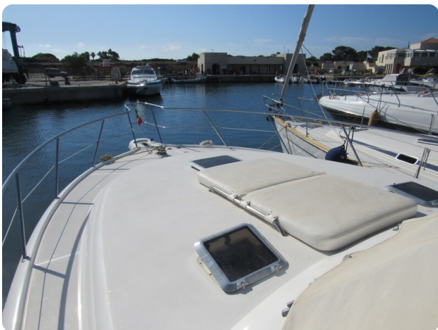
Tiara 3800 Open,