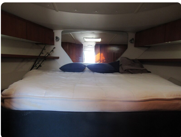
Tiara 3800 Open, berth