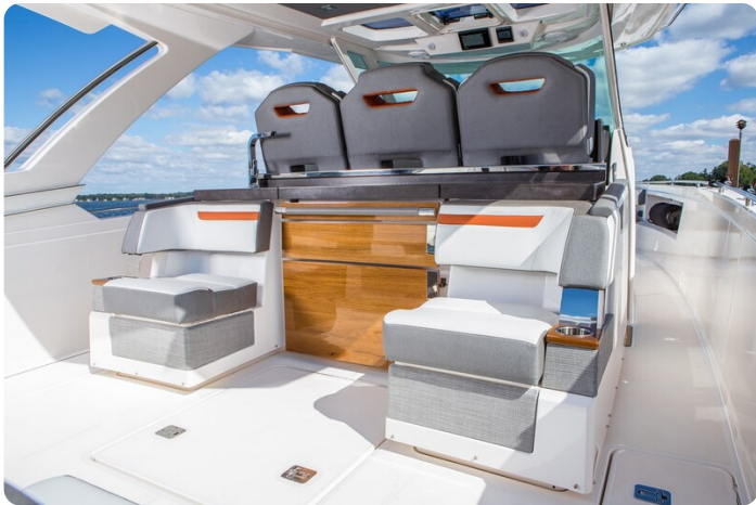
Tiara 38 LS cockpit galley