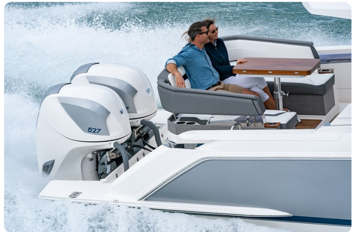
Tiara 38 LS rotating lounge