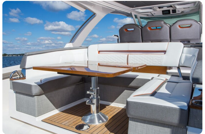
Tiara 38 LS cockpit dinette