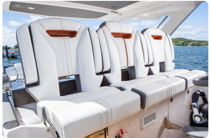
Tiara 38 LS pilot seats