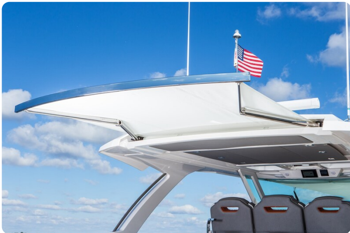
Tiara 38 LS cockpit sunshade