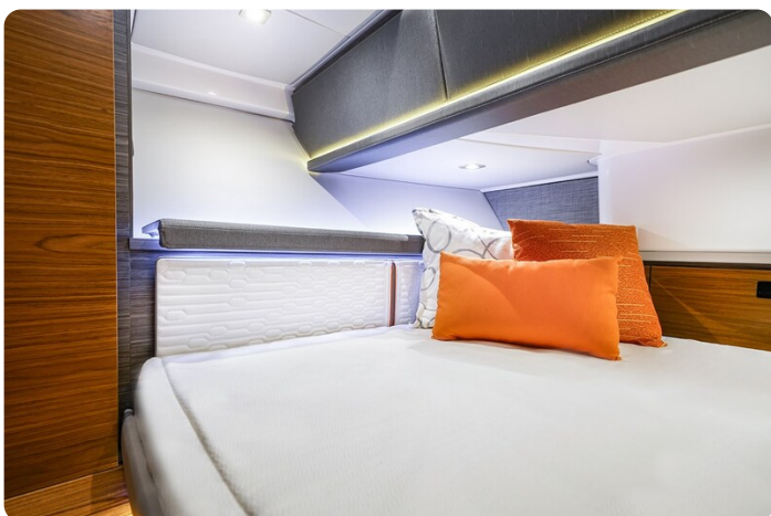
Tiara 38 LS full berth