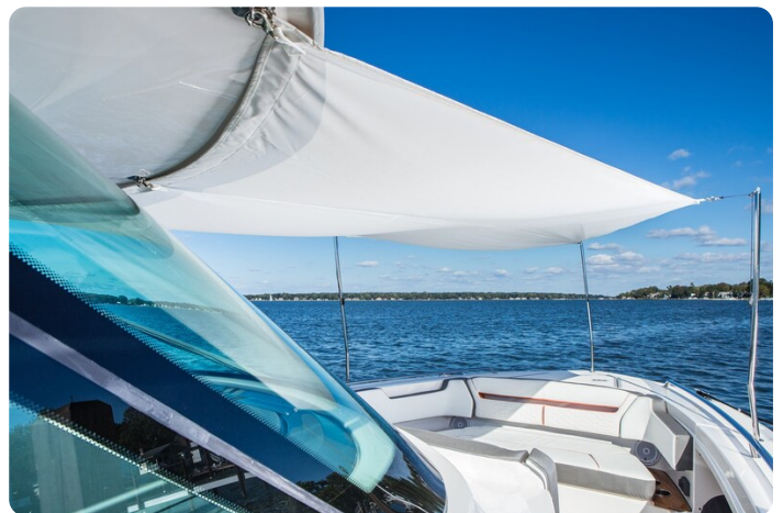
Tiara 38 LS fwd sunshade