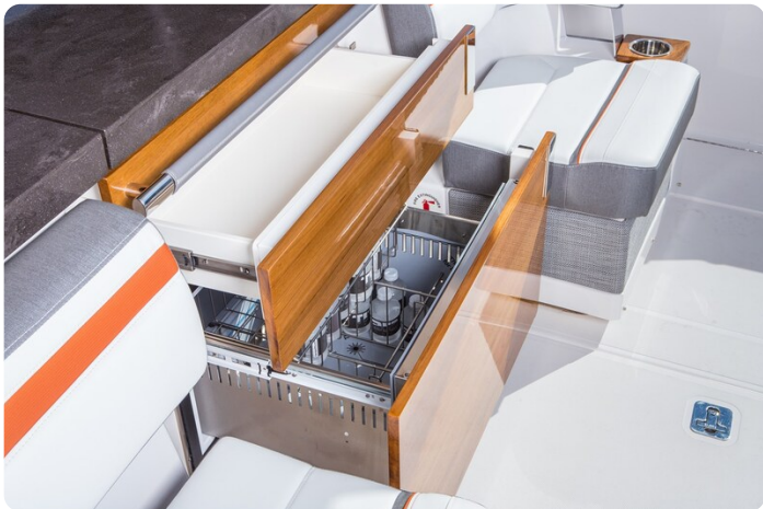
Tiara 38 LS refrigerator