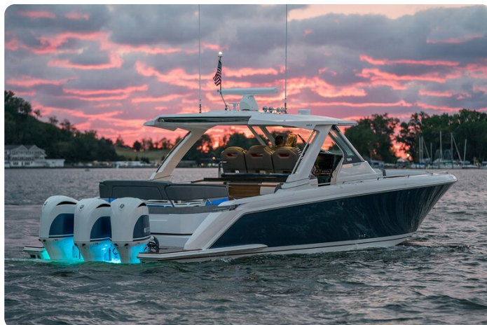
Tiara 38 LS aft profile