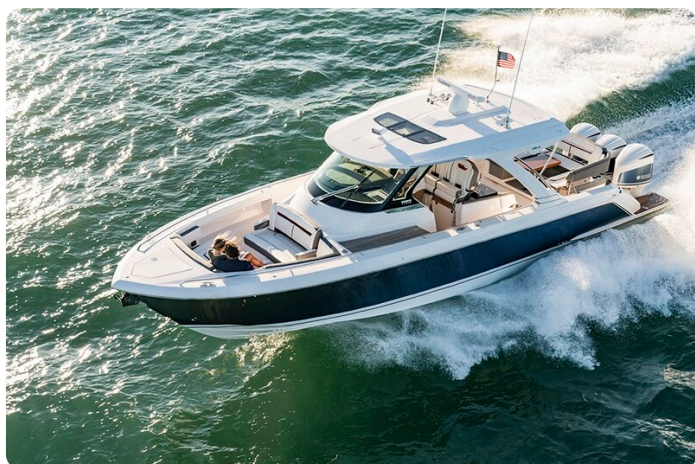
Tiara 38 LS bow profile aerial