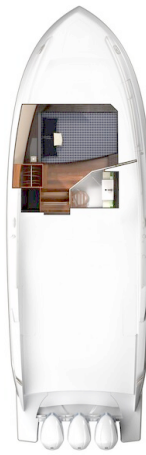
Tiara 38 LS lower layout