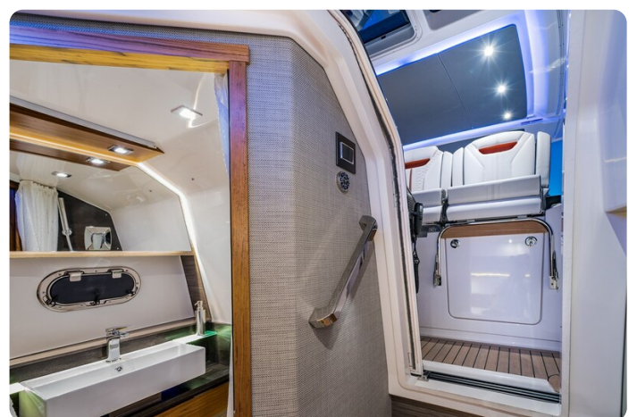
Tiara 38 LS head