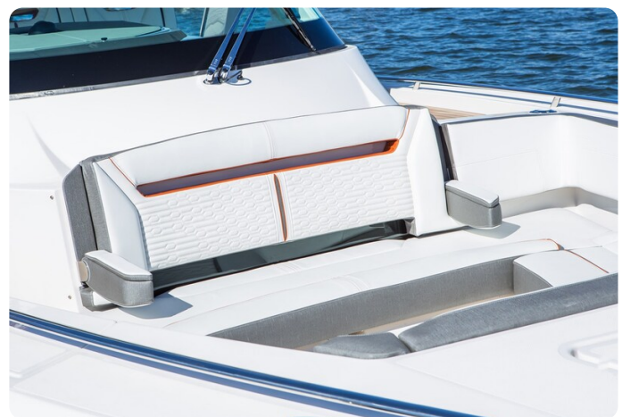
Tiara 38 LS fwd dinette