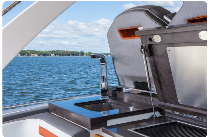
Tiara 38 LS countertop