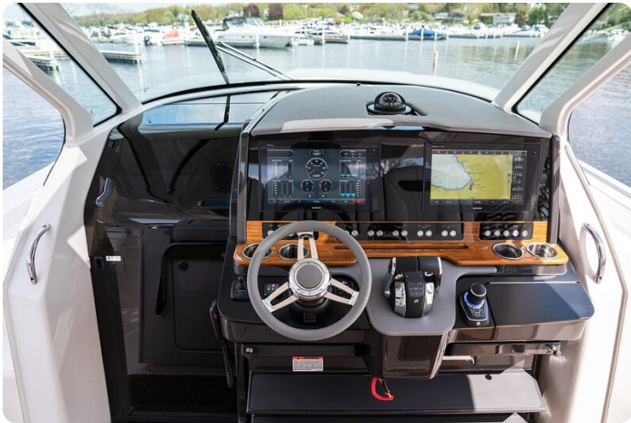
Tiara 38 LS helm station