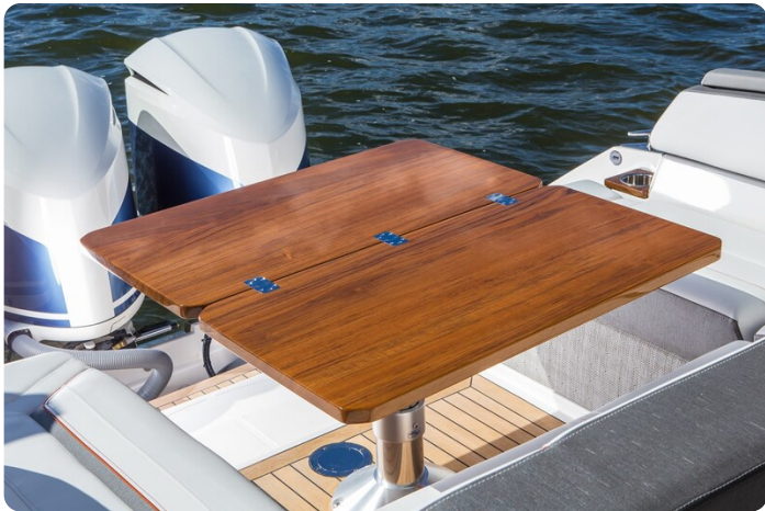
Tiara 38 LS aft table