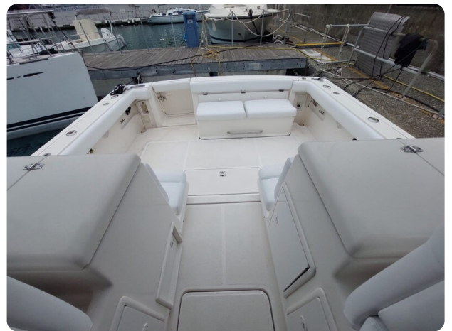
Tiara 3500 Open Sampei cockpit view