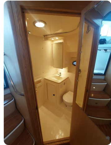
Tiara 3500 Open Sampei bathroom