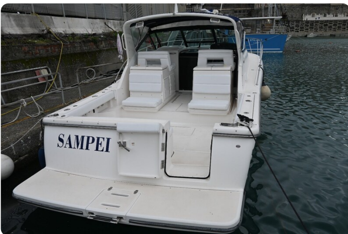
Tiara 3500 Open Sampei stern view