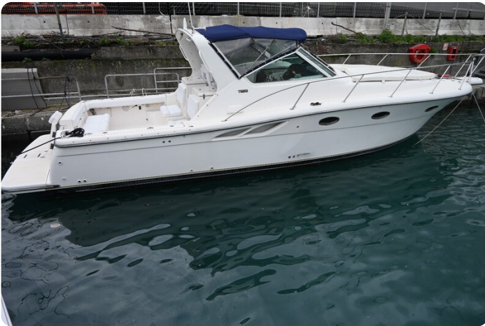
Tiara 3500 Open Sampei profile