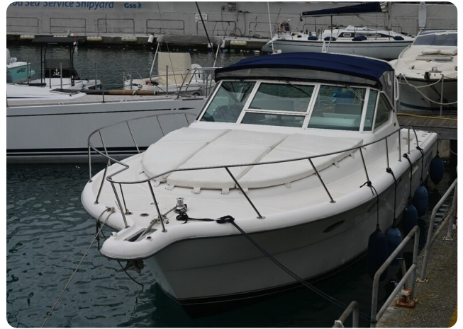
Tiara 3500 Open Sampei bow view