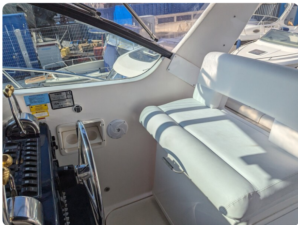
Tiara 3500 Open pilot seat