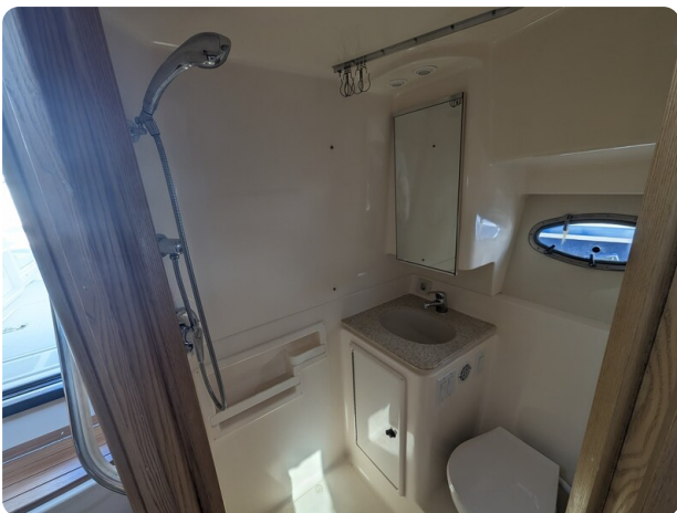
Tiara 3500 Open head