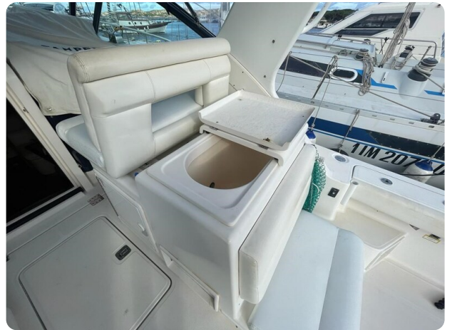
Tiara 3500 Open cockpit detail.jpg