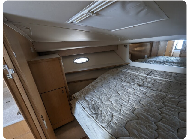
Tiara 3500 Open master cabin