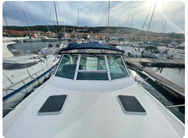
Tiara 3500 Open fwd deck.jpg