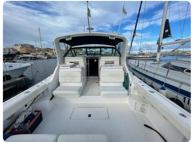
Tiara 3500 Open cockpit.jpg