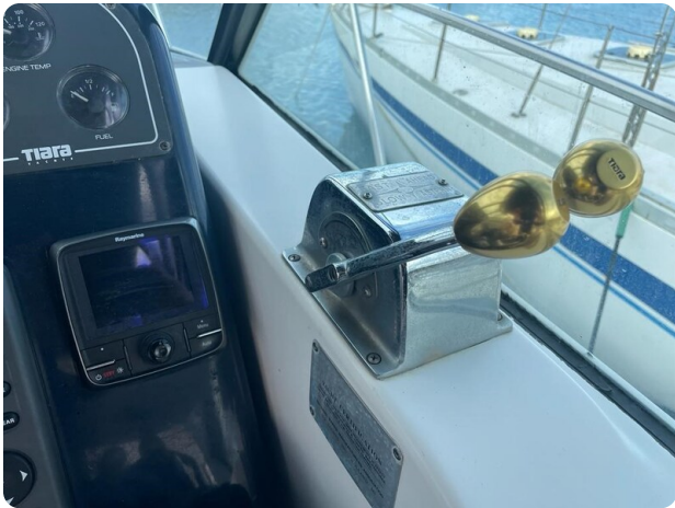
Tiara 3500 Open controls.jpg