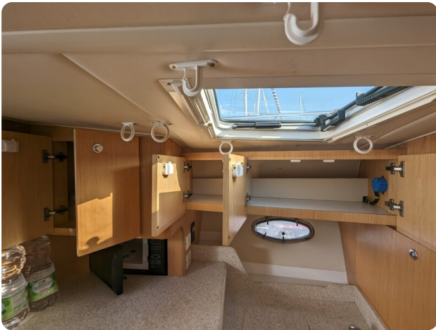
Tiara 3500 Open galley detail