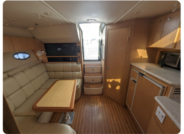
Tiara 3500 Open interiors