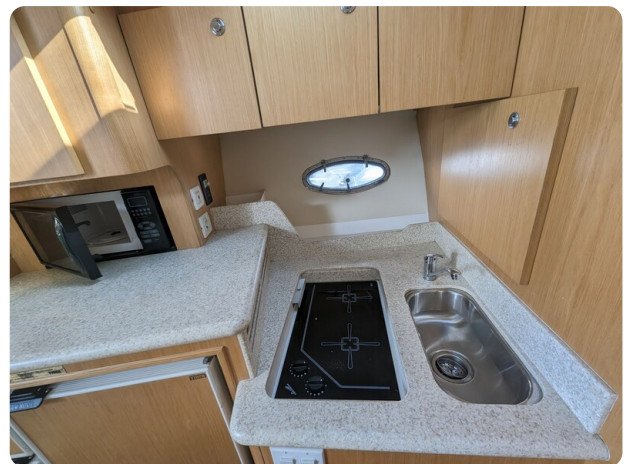
Tiara 3500 Open galley