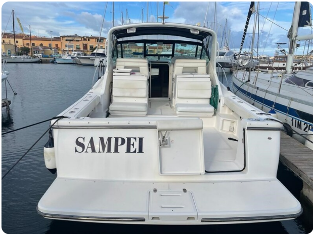
Tiara 3500 Open aft view.jpg