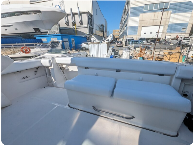
Tiara 3500 Open, aft seat