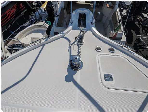
Tiara 3500 Open, bow pulpit