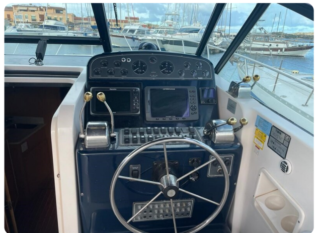
Tiara 3500 Open helm.jpg