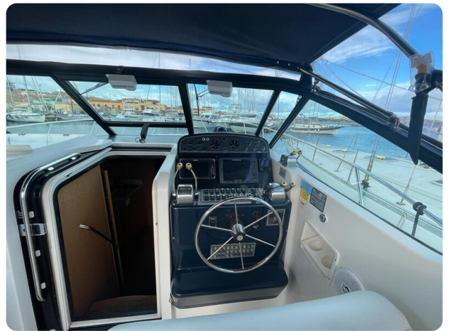
Tiara 3500 Open helm station.jpg