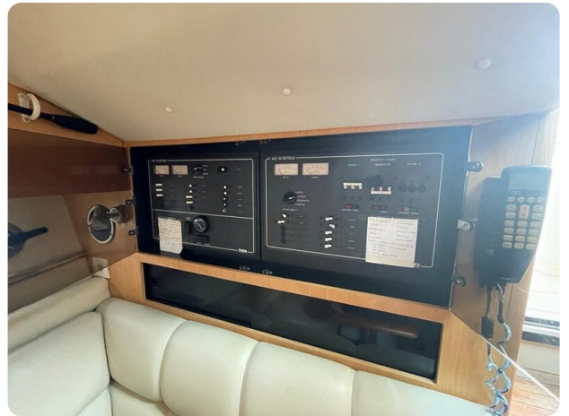
Tiara 3500 Open electrical panel.jpg