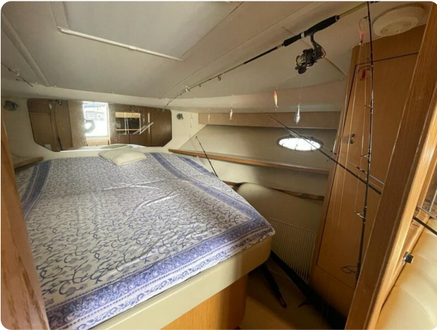
Tiara 3500 Open cabin.jpg