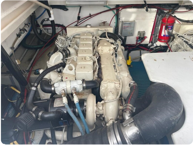
Tiara 3500 Open engine detail.jpg