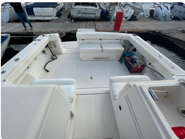
Tiara 3500 Open cockpit 2.jpg