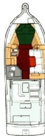
Tiara 3500 layout