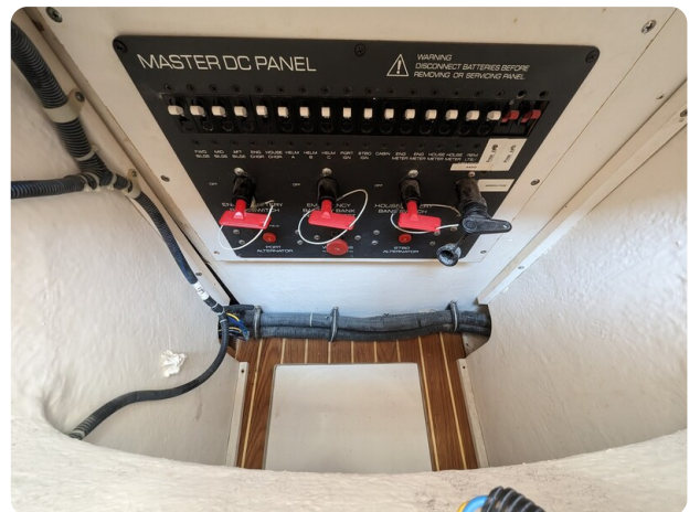
Tiara 3500 Open details view