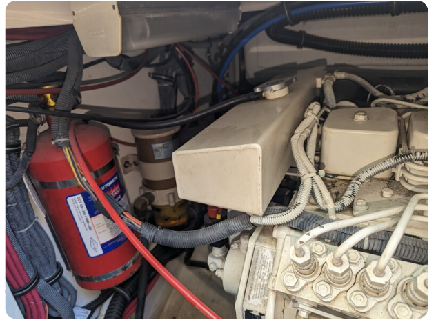
Tiara 3500 Open engine detail