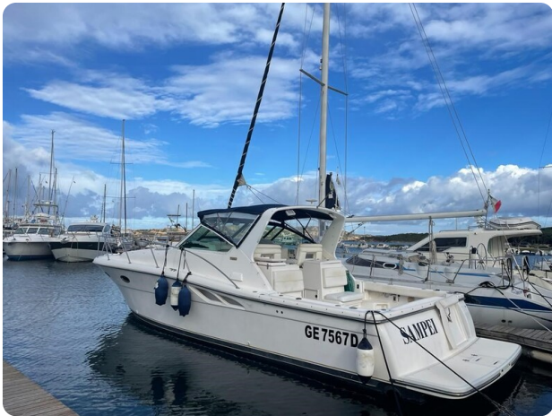
Tiara 3500 Open aft profile.jpg