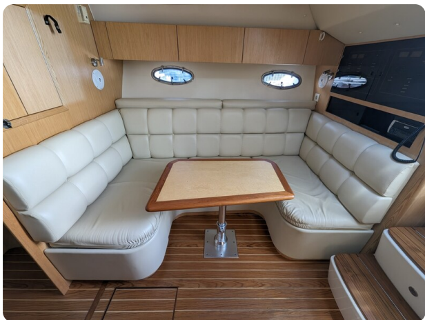
Tiara 3500 Open dinette