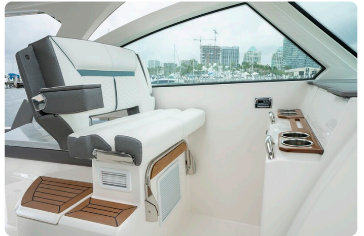
Tiara 34 LX port seat