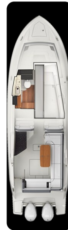
Tiara 34 LX layout