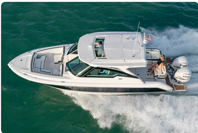
Tiara 34 LX aerial view