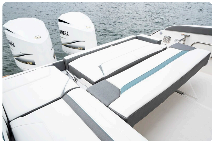
Tiara 34 LX convertible aft sunpad