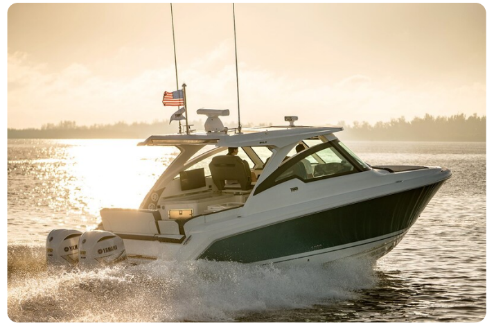
Tiara 34 LX running 2