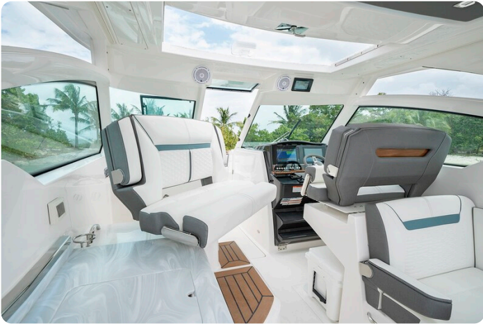
Tiara 34 LX detail