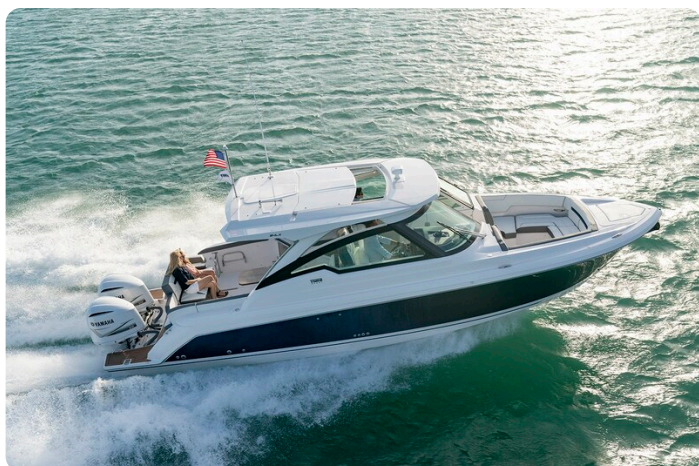
Tiara 34 LX cruising