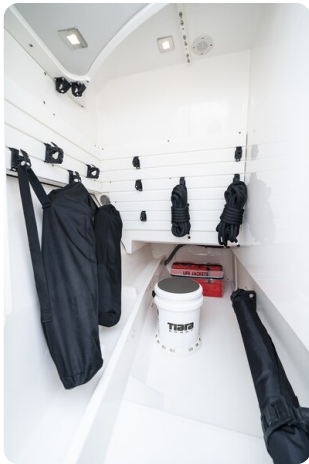
Tiara 34 LX port storage