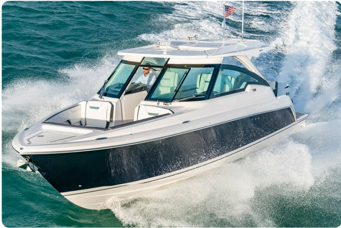
Tiara 34 LX Sport running