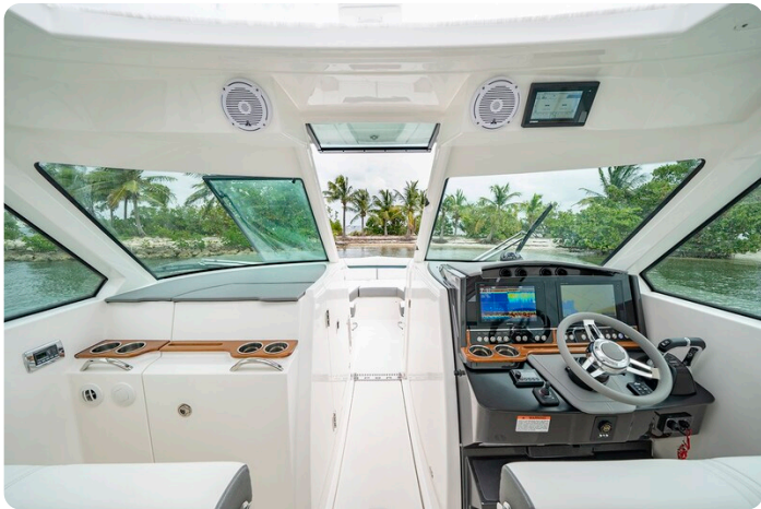
Tiara 34 LX helm station