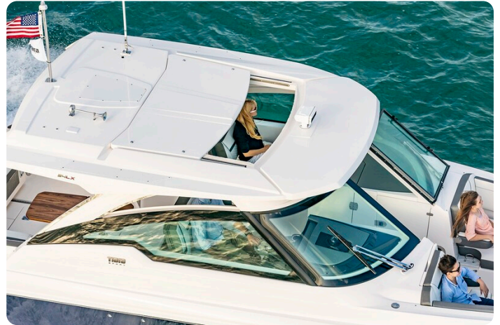
Tiara 34 LX Hard Top