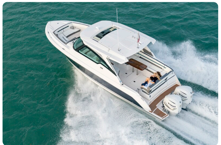
Tiara 34 LX Sport cruising