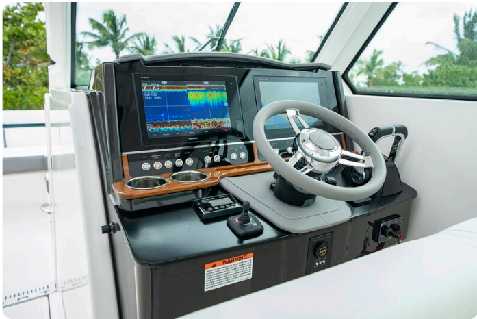
Tiara 34 LX helm