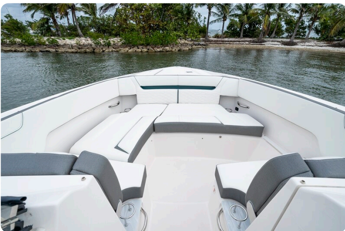
Tiara 34 LX fwd dinette (2)