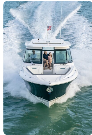
Tiara 34 LX bow