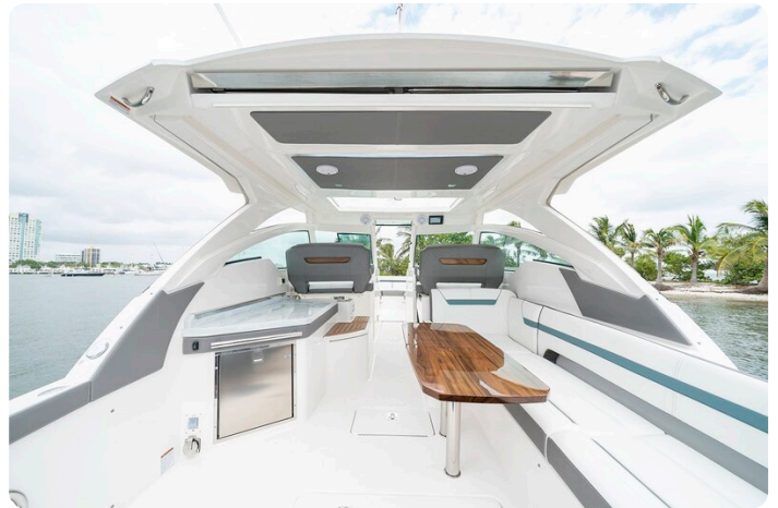
Tiara 34 LX details