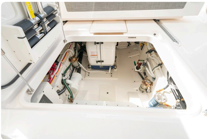
Tiara 34 LX lazarette