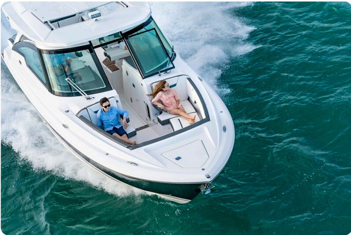
Tiara 34 LX fwd dinette