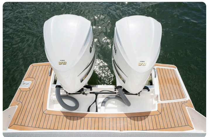
Tiara 34 LX platform