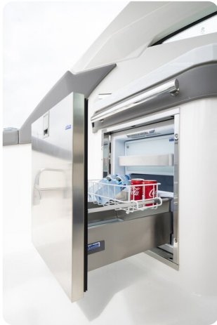
Tiara 34 LX fridge