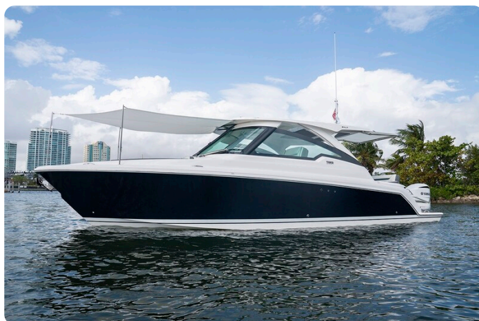
Tiara 34 LX bow profile