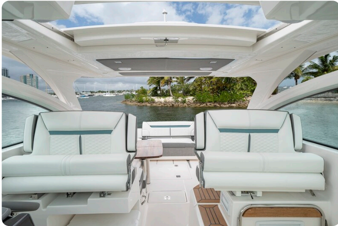
Tiara 34 LX view to aft