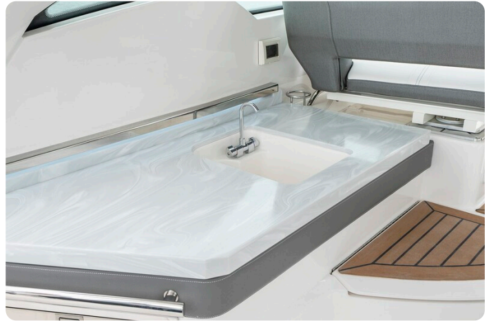
Tiara 34 LX cockpit sink