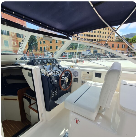
Tiara 2900 Coronet helm station