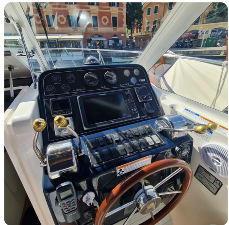
Tiara 2900 Coronet helm