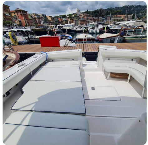
Tiara 2900 Coronet cockpit sunpad