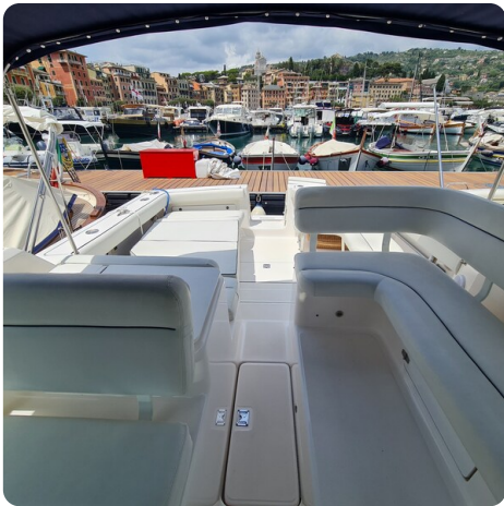
Tiara 2900 Coronet cockpit to aft