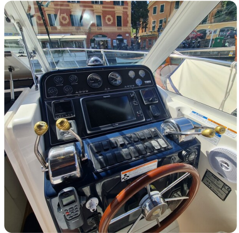
Tiara 2900 Coronet helm