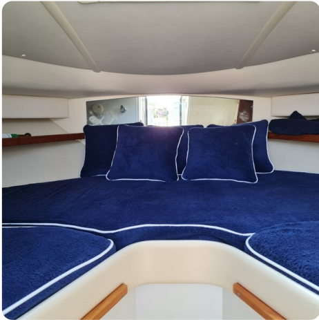
Tiara 2900 Coronet cabin's berth