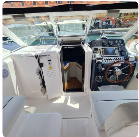
Tiara 2900 Coronet cabin door