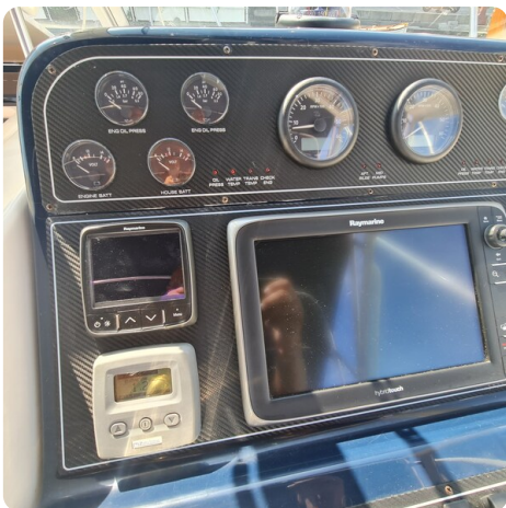
Tiara 2900 Coronet Helm detail