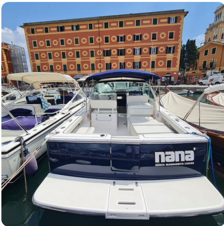
Tiara 2900 Coronet transom