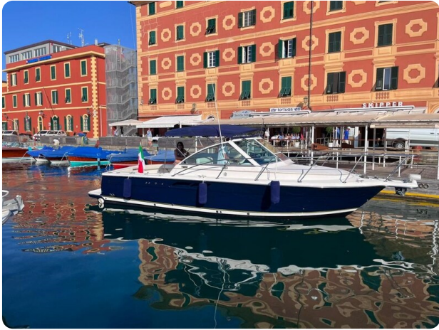
Tiara 2900 Coronet profile