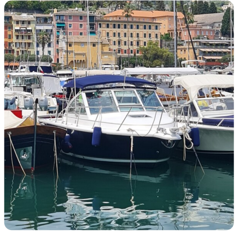
Tiara 2900 Coronet bow view