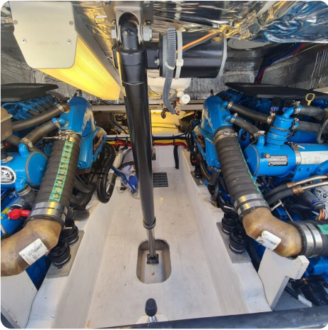
Tiara 2900 Coronet engine room