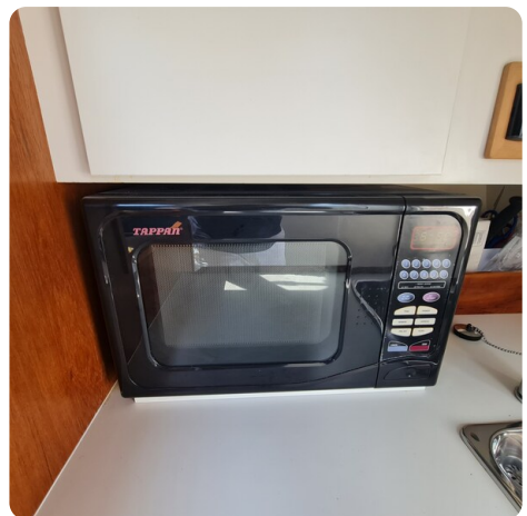
Tiara 2900 Coronet microwave combi