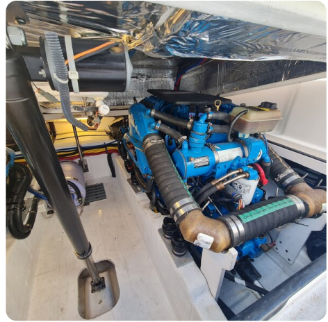
Tiara 2900 Coronet stbd engine