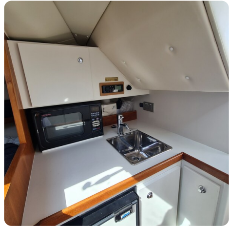
Tiara 2900 Coronet galley