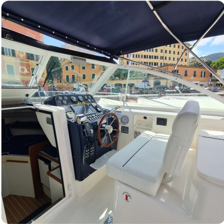
Tiara 2900 Coronet helm station