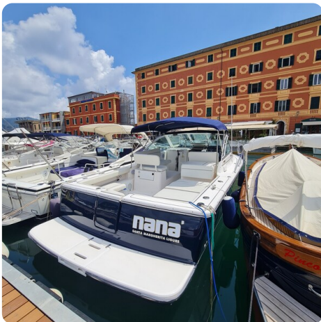
Tiara 2900 Coronet aft profile