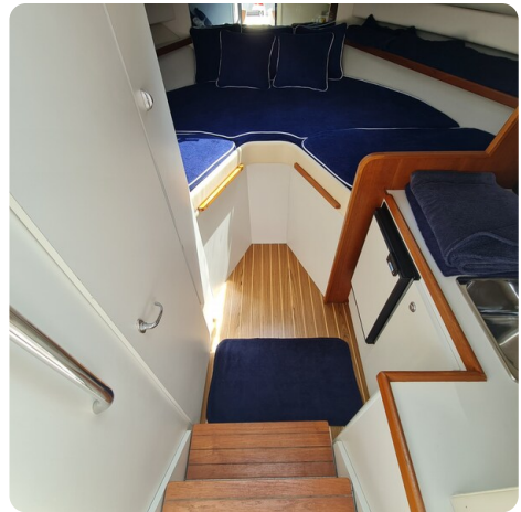
Tiara 2900 Coronet cabin