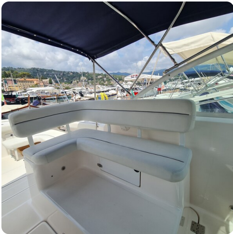
Tiara 2900 Coronet cockpit lounge