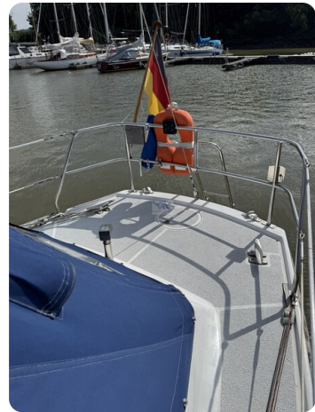
Targa 9.60m FOXY LADY 36