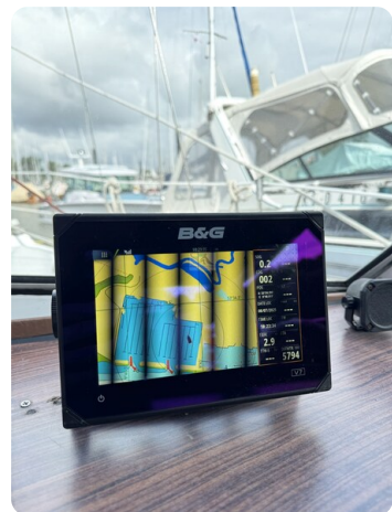
Targa 9.60m FOXY LADY 45