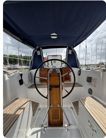
Targa 9.60m FOXY LADY 55