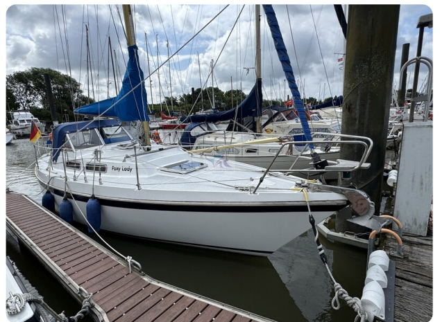
Targa 9.60m FOXY LADY 57