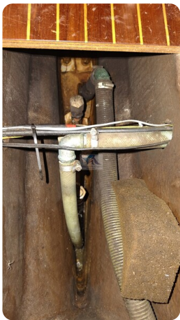
Sweden 340 SPITZMAUS 29