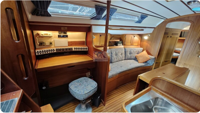
Sweden 340 SPITZMAUS 3