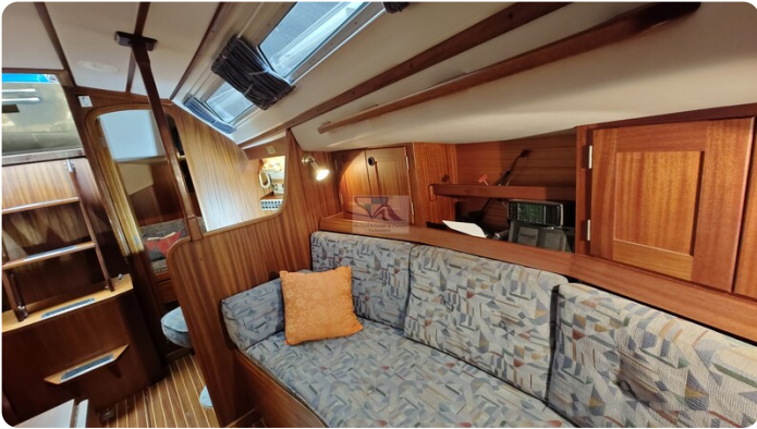
Sweden 340 SPITZMAUS 21