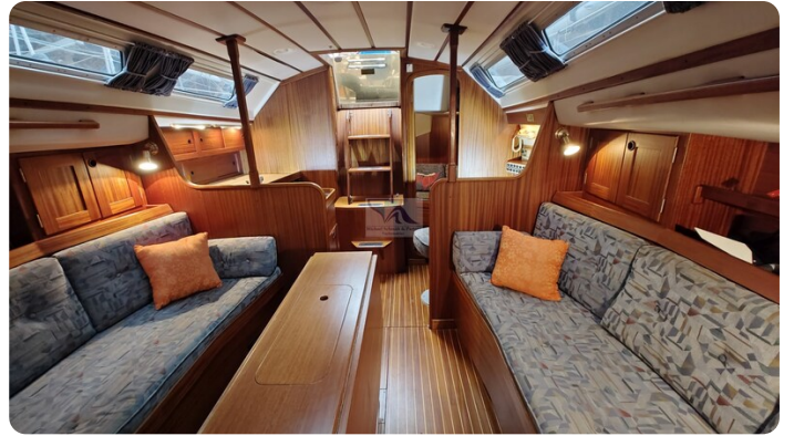
Sweden 340 SPITZMAUS 55