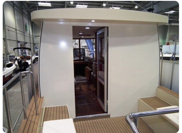
Hausboot SM 30 msp-398859 (16)