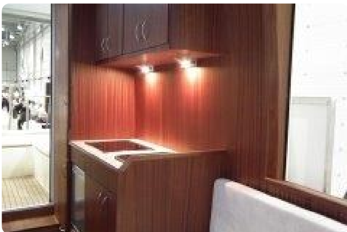
Hausboot SM 30 msp-398859 (30)