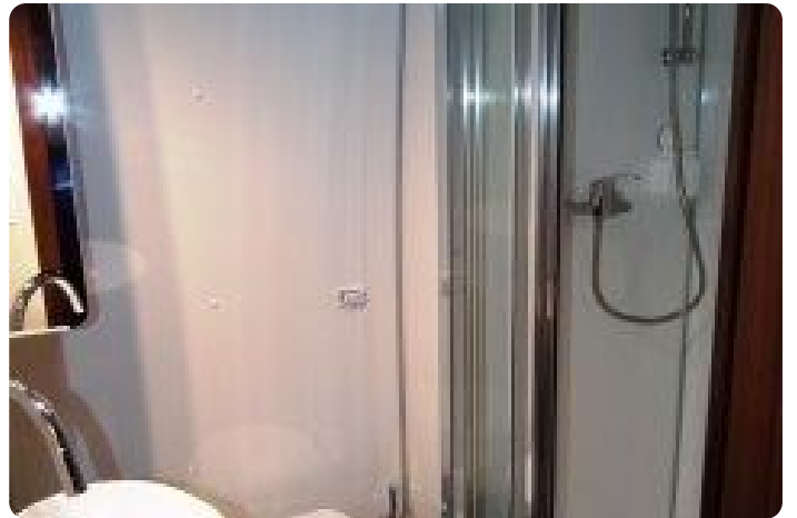
Hausboot SM 30 msp-398859 (27)