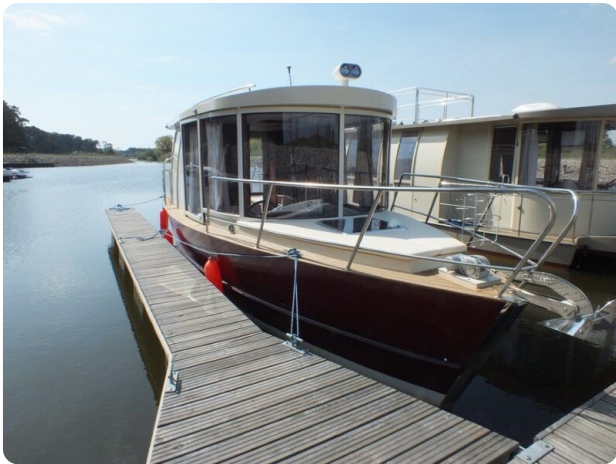
Hausboot SM 30 msp-398859 (24)