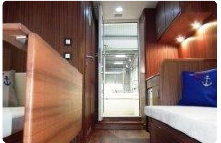
Hausboot SM 30 msp-398859 (29)