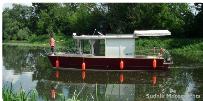
Hausboot SM 30 msp-398859 (22)