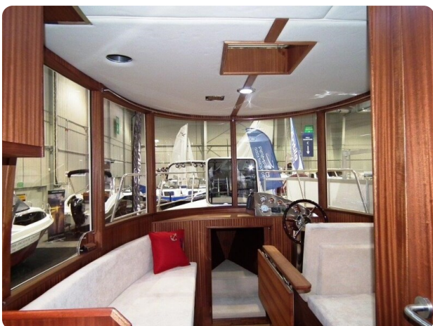
Hausboot SM 30 msp-398859 (20)