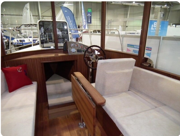
Hausboot SM 30 msp-398859 (18)