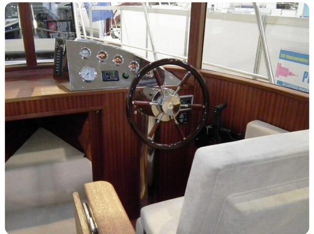
Hausboot SM 30 msp-398859 (19)