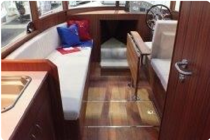
Hausboot SM 30 msp-398859 (26)