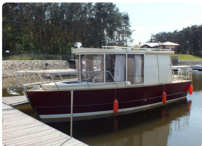
Hausboot SM 30 msp-398859 (23)