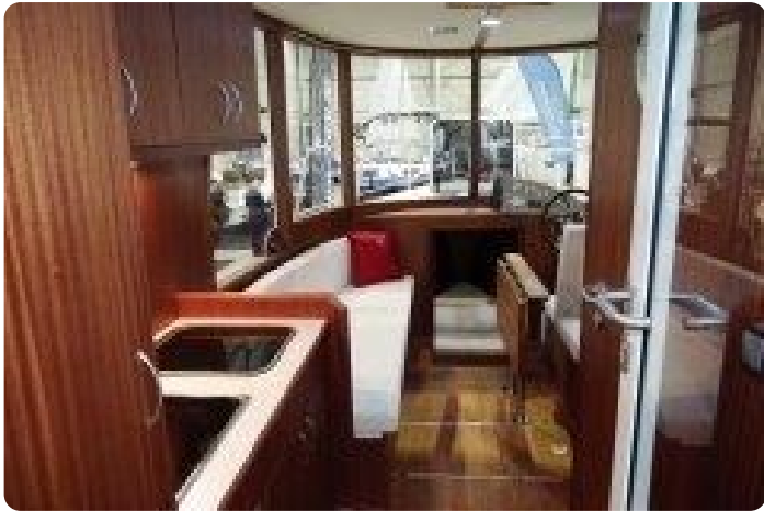
Hausboot SM 30 msp-398859 (28)