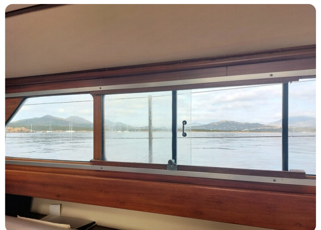
Storebro wide side windows