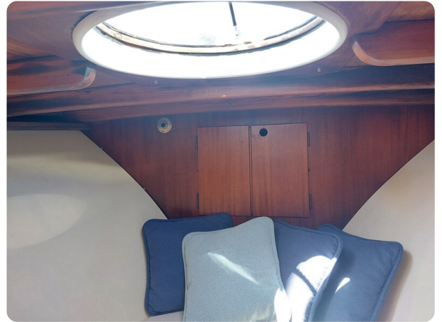
Storebro detail cabin