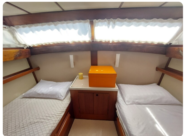
Storebro vip cabin