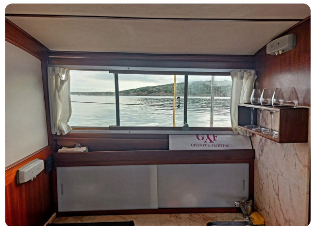
Storebro galley detail