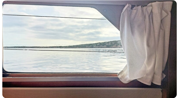
Storebro wc wide side windows