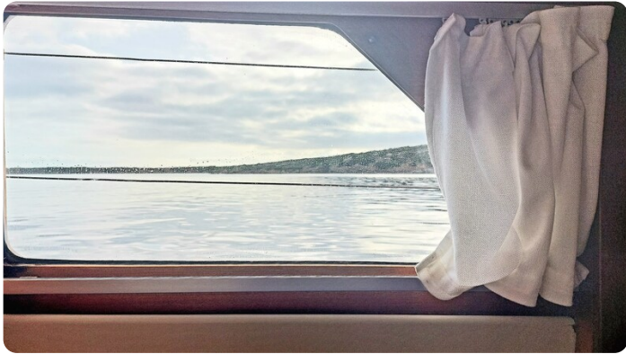
Storebro wc wide side windows