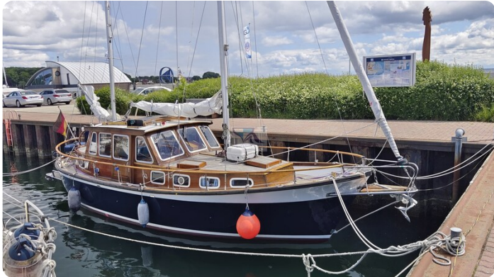
Nauticat 33 NORDSTRAND 2