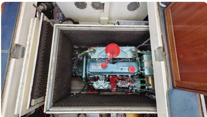
Nauticat 33 NORDSTRAND 1