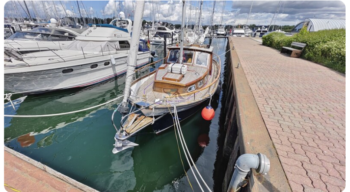
Nauticat 33 NORDSTRAND 6