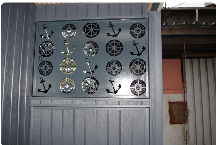
Shogun Hausboot 1000 23