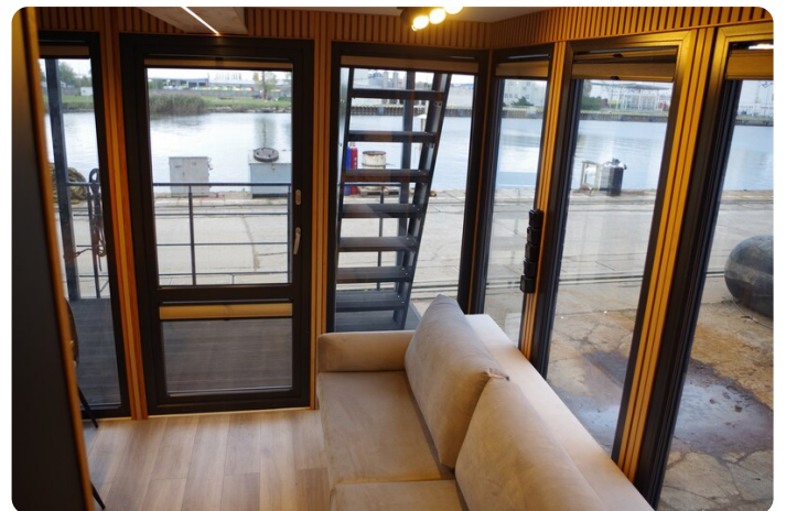
Shogun Hausboot 1000 18