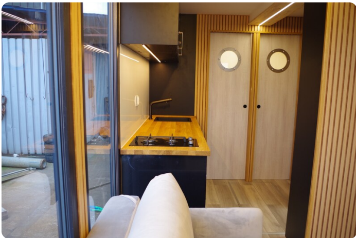
Shogun Hausboot 1000 21