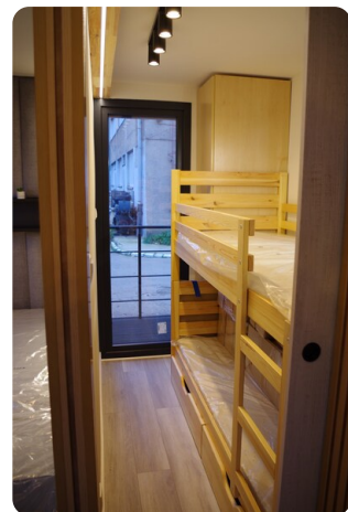
Shogun Hausboot 1000 11