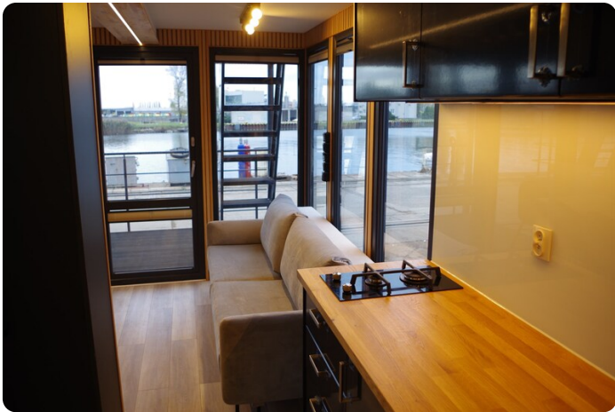
Shogun Hausboot 1000 19