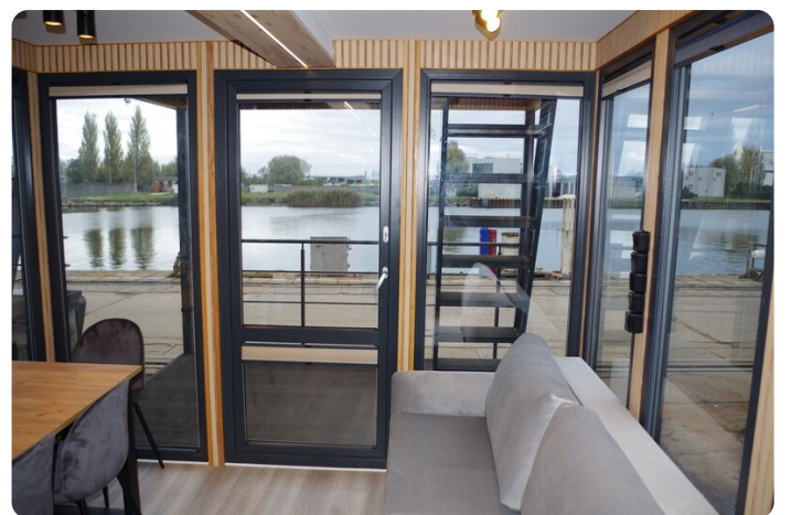
Shogun Hausboot 1000 5