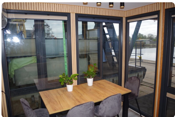
Shogun Hausboot 1000 4