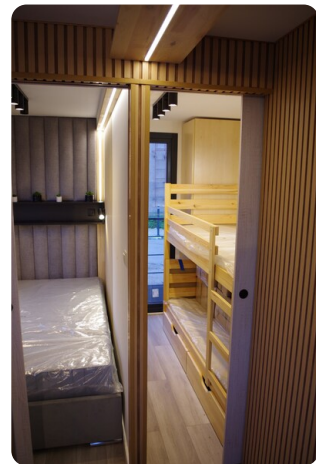
Shogun Hausboot 1000 9