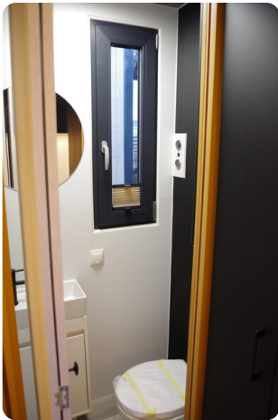
Shogun Hausboot 1000 12