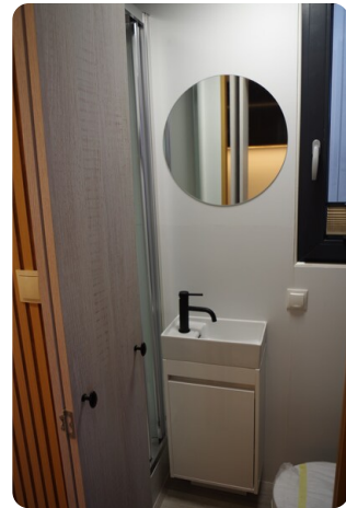
Shogun Hausboot 1000 13