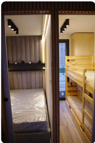
Shogun Hausboot 1000 8