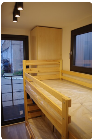
Shogun Hausboot 1000 10