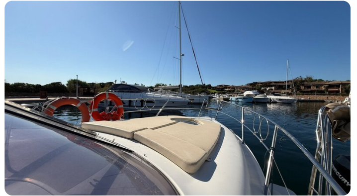
Fwd deck side