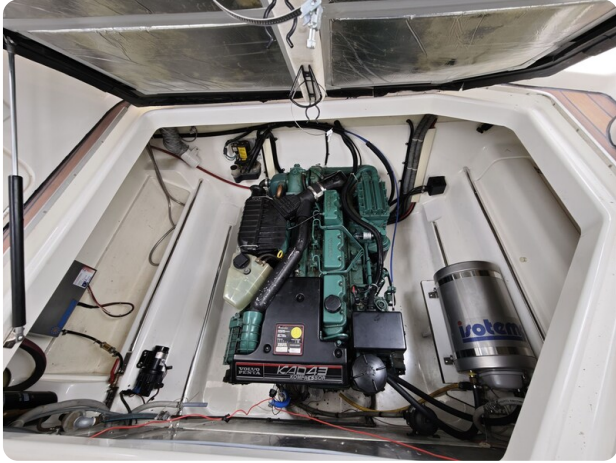
Sealine 28 BELLA 1