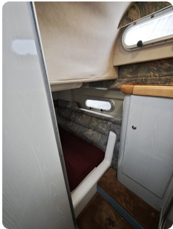
Sealine 28 BELLA 30