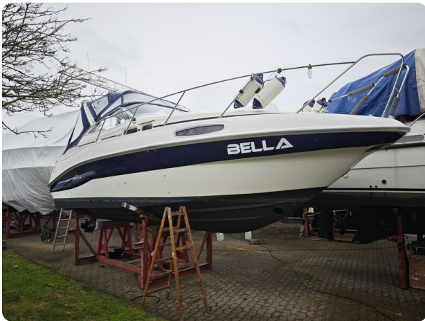
Sealine 28 BELLA 61