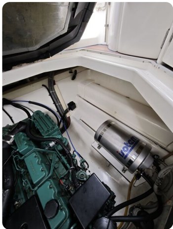
Sealine 28 BELLA 6