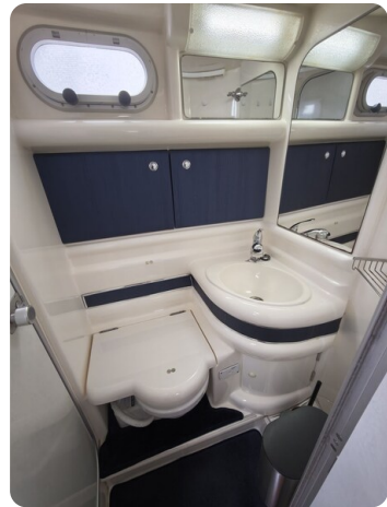
Sealine 28 BELLA 25