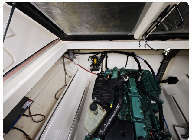
Sealine 28 BELLA 7