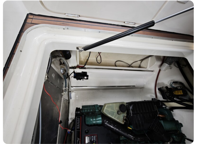
Sealine 28 BELLA 3