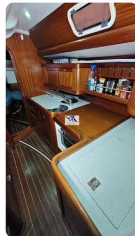
Sunbeam 39 142