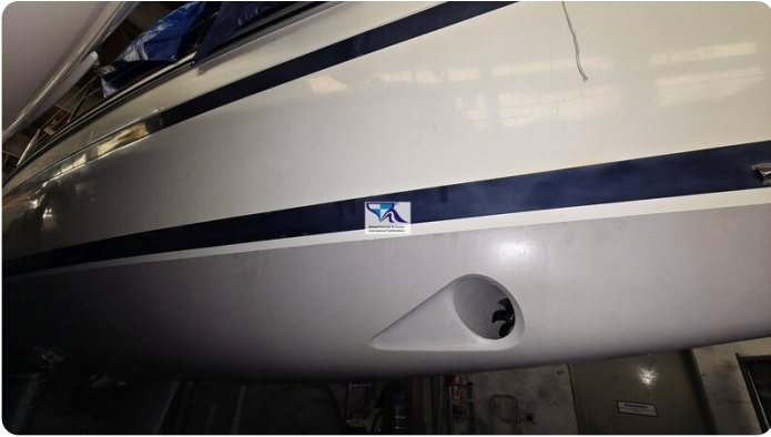
Sunbeam 39 86