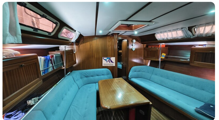
Sunbeam 39 129