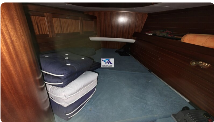
Sunbeam 39 153