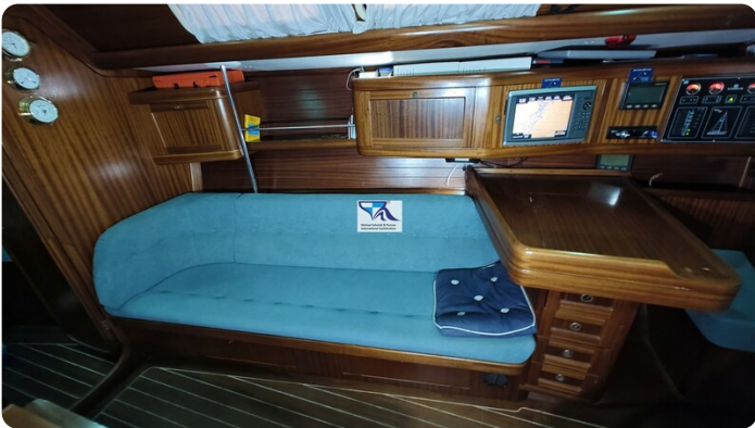
Sunbeam 39 138