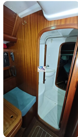
Sunbeam 39 140