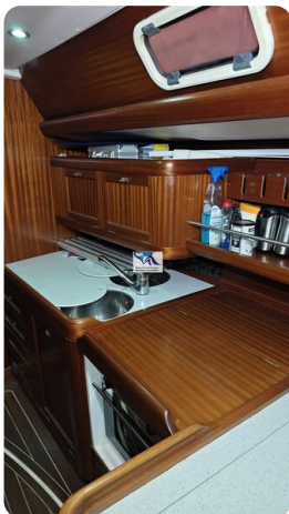
Sunbeam 39 141