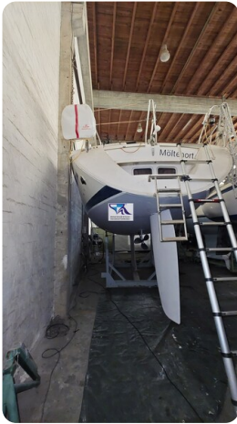
Sunbeam 39 93