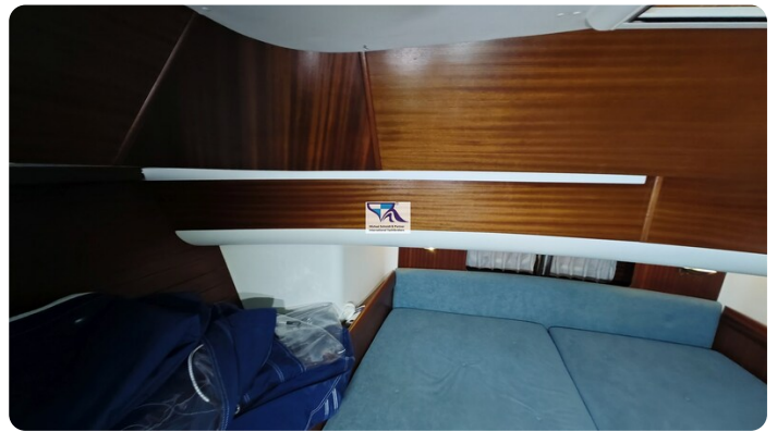
Sunbeam 39 151