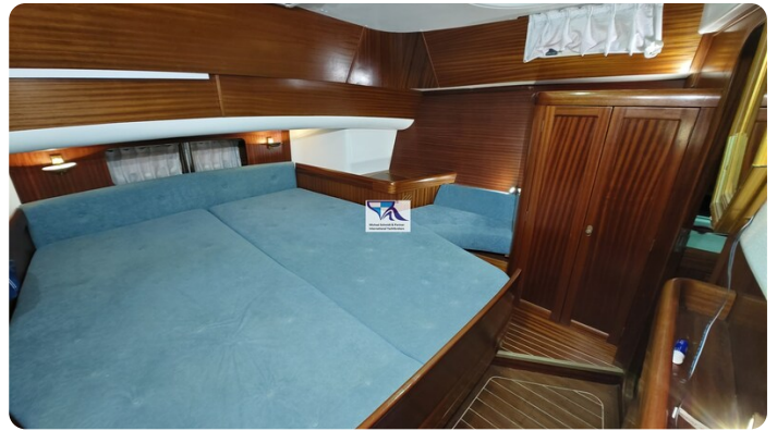
Sunbeam 39 147