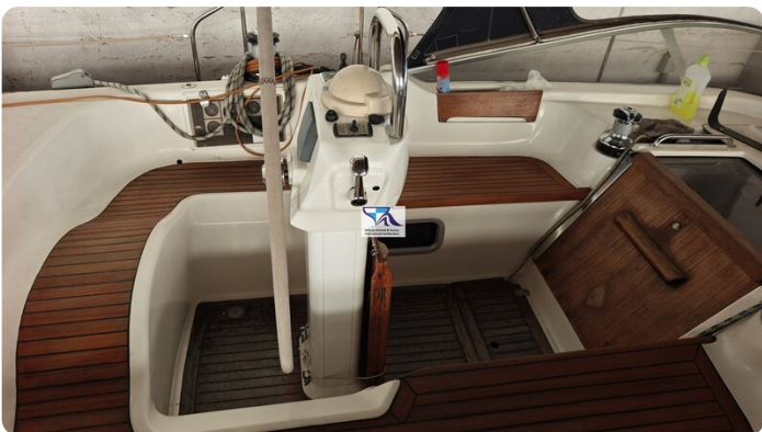
Sunbeam 39 105