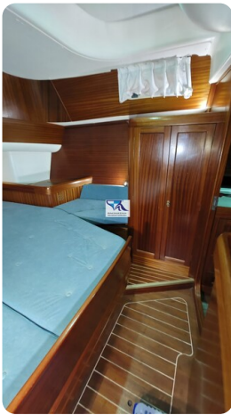
Sunbeam 39 149