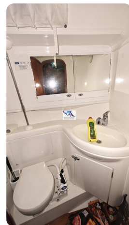
Sunbeam 39 154