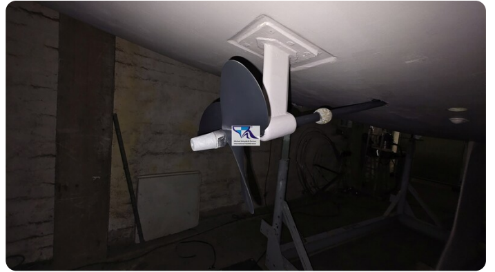
Sunbeam 39 90