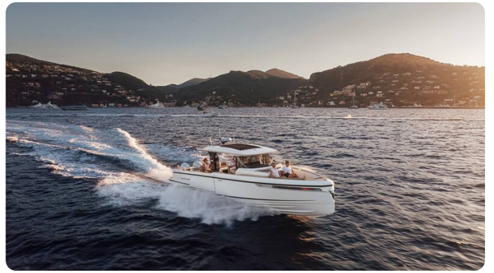
SAXDOR 400 GTS Cruising