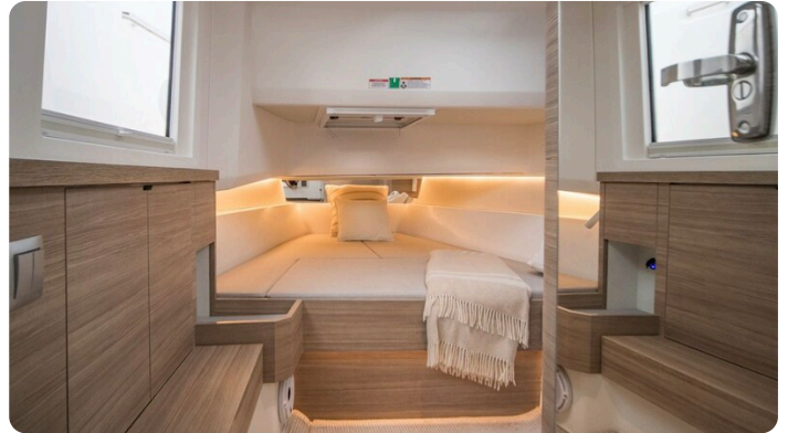
SAXDOR 400 GTS Cabin