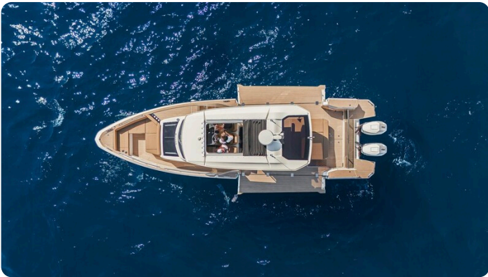
SAXDOR 400 GTS Top view