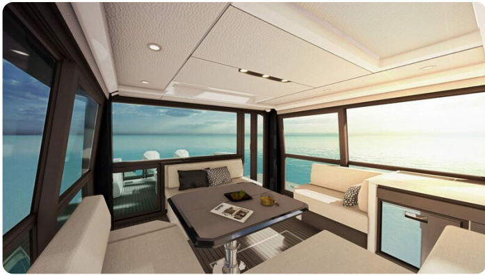
Saxdor 400 GTC salon