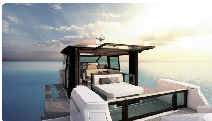
Saxdor 400 GTC cockpit view