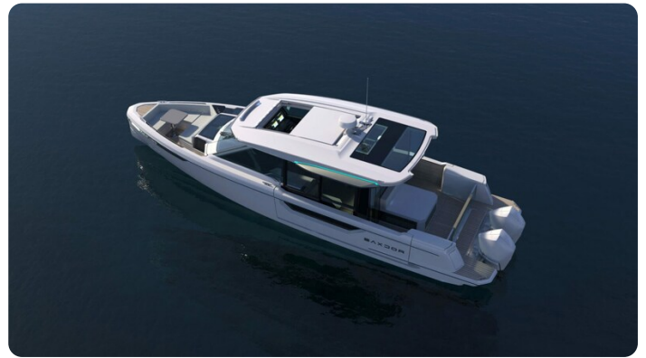
Saxdor 400 GTC aerial