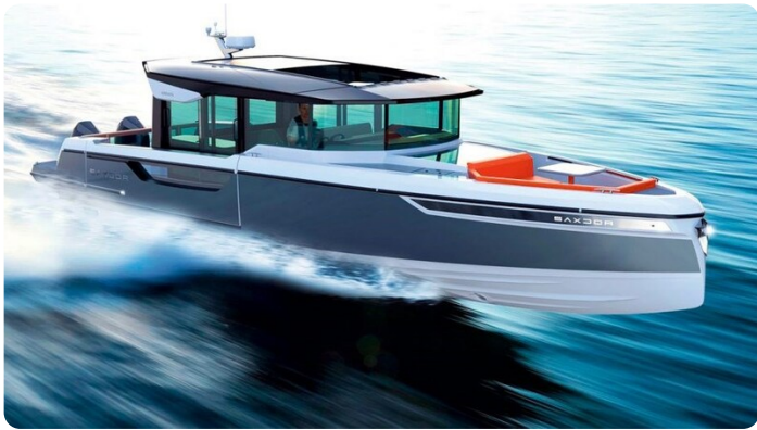
Saxdor 400 GTC running