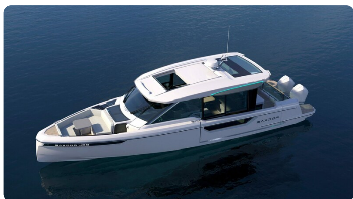
Saxdor 400 GTC aerial