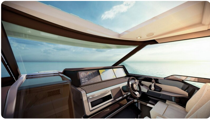
Saxdor 400 GTC helm station