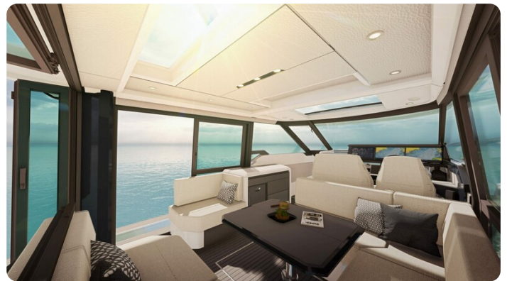
Saxdor 400 GTC interiors