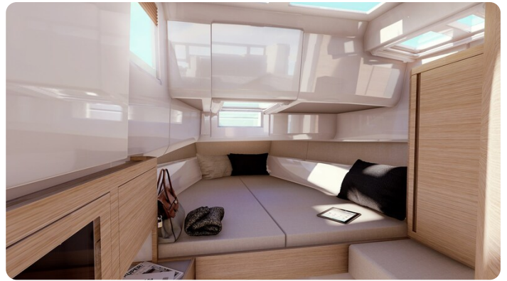
Saxdor 400 GTC cabin