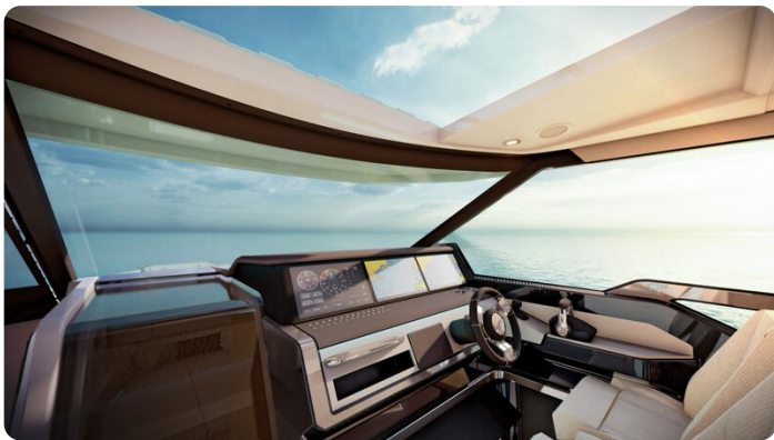
Saxdor 400 GTC helm station