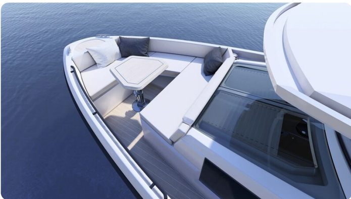
Saxdor 340 WA bow dinette