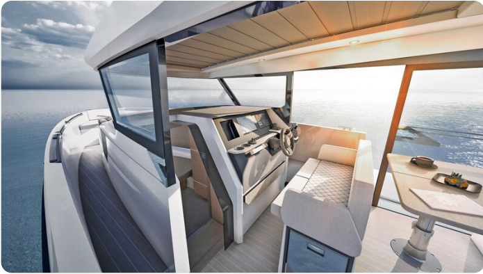
Saxdor 340 WA helm station