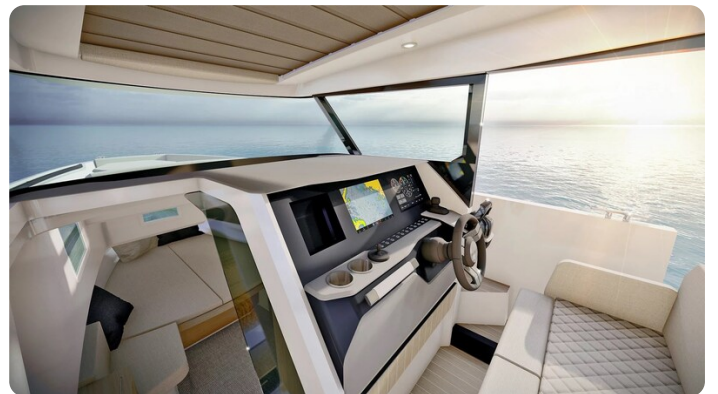
Saxdor 340 WA helm