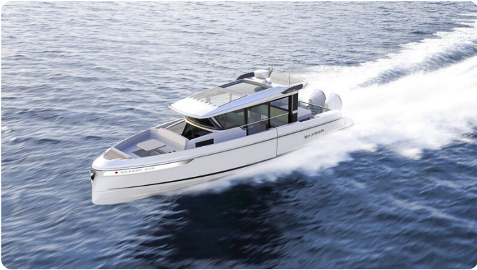
Saxdor 340 WA aerial view