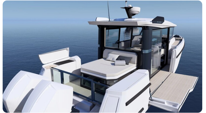
Saxdor 340 WA cockpit detail