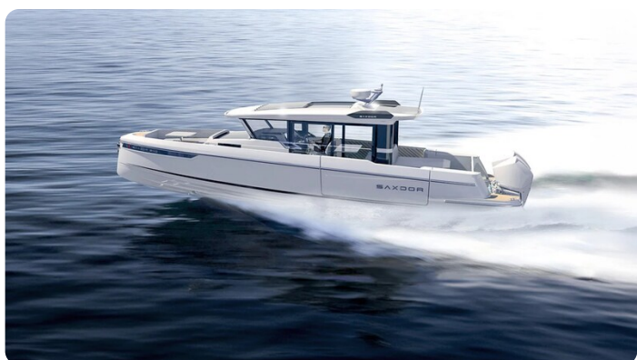
Saxdor 340 WA running