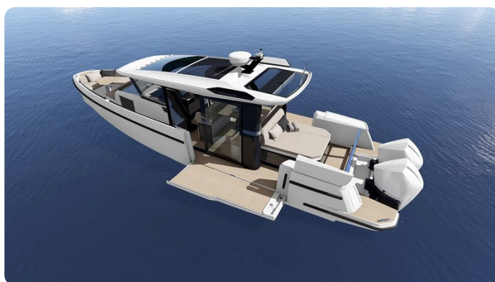
Saxdor 340 WA opened wings