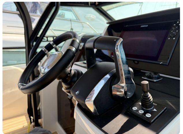
Saxdor 320 GTO Helm console detail