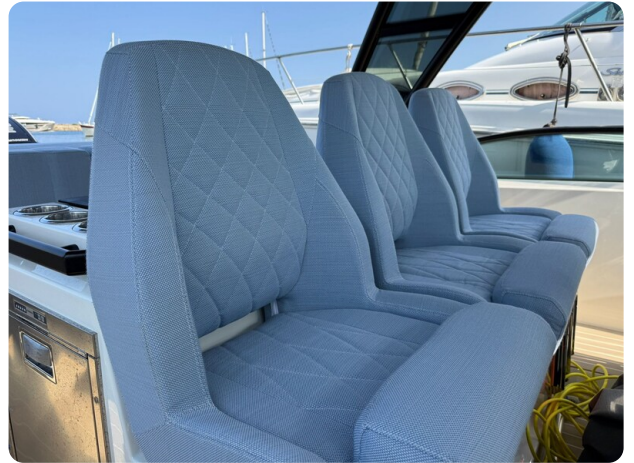
Saxdor 320 GTO Front Seats