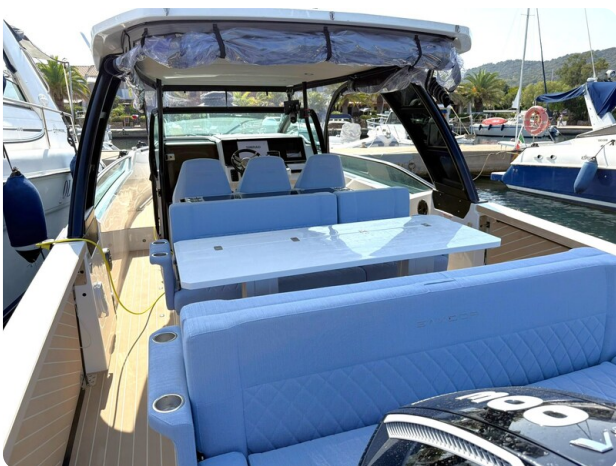
Saxdor 320 GTO Aft View