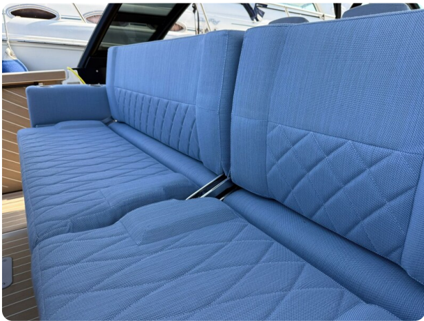
Saxdor 320 GTO Galley Seats