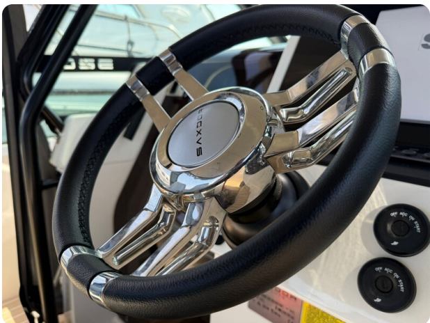
Saxdor 320 GTO Wheel