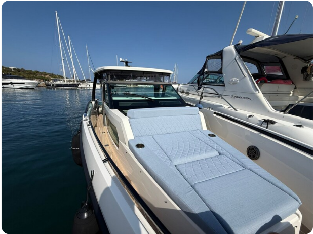
Saxdor 320 GTO Bow