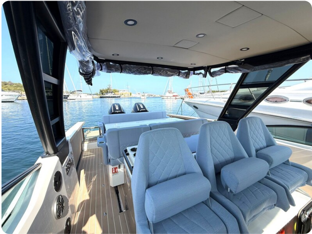
Saxdor 320 GTO Cockpit