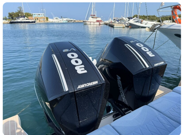
Saxdor 320 GTO Outboards