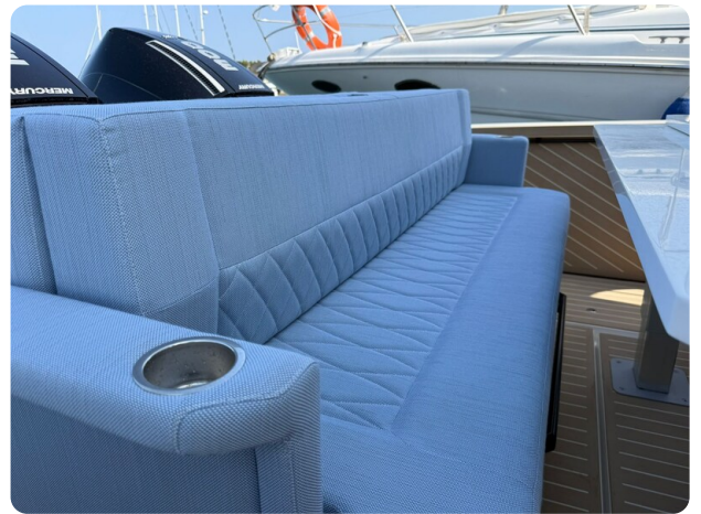
Saxdor 320 GTO Aft Seats