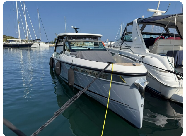
Saxdor 320 GTO Fwd Profile