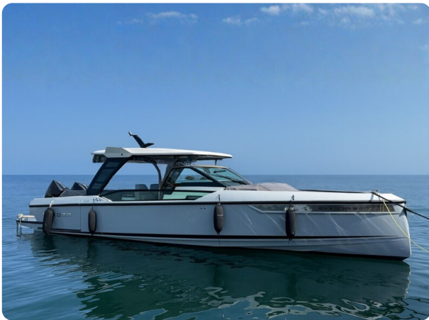
Saxdor 320 GTO Profile