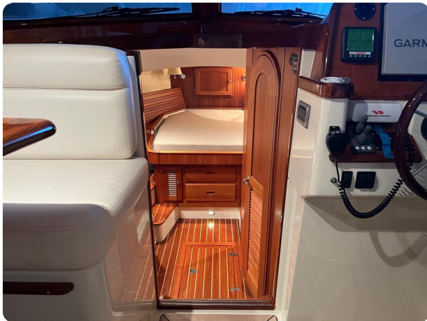
San Juan 40, lower deck access