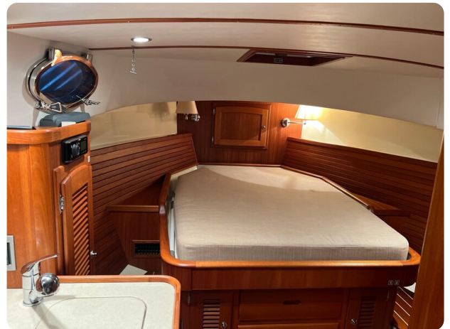
San Juan 4, berth0