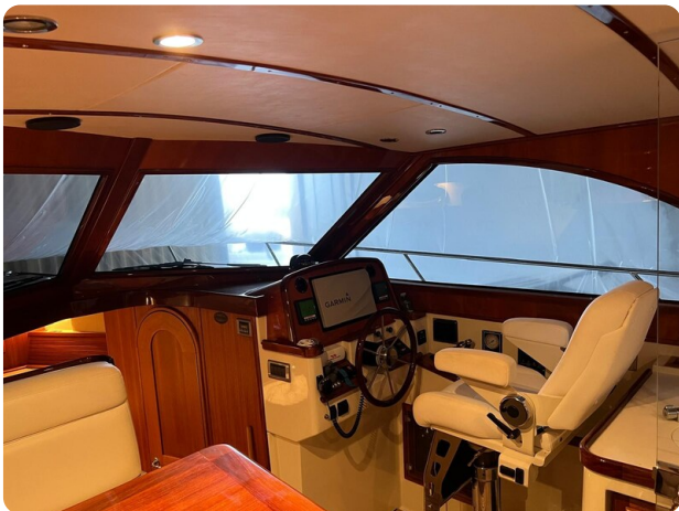
San Juan 40, helm station