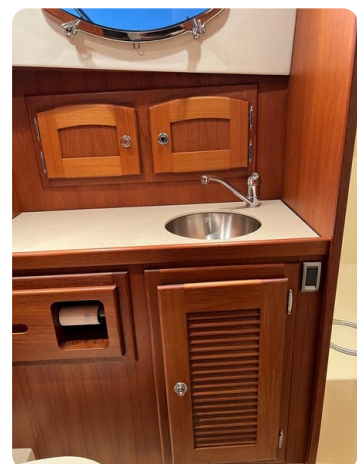
San Juan 40 bathroom