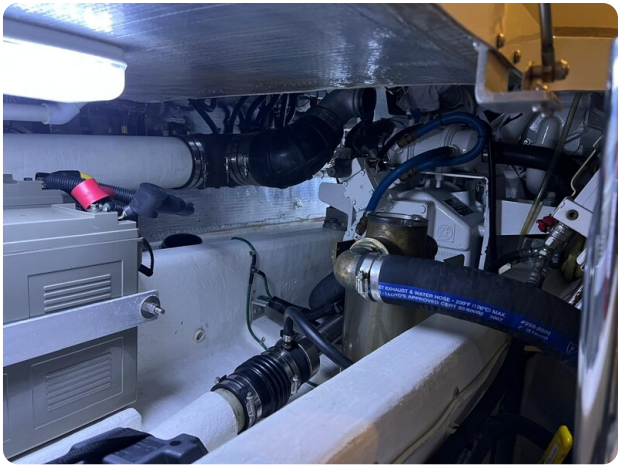
San Juan 40, engine room detail 1