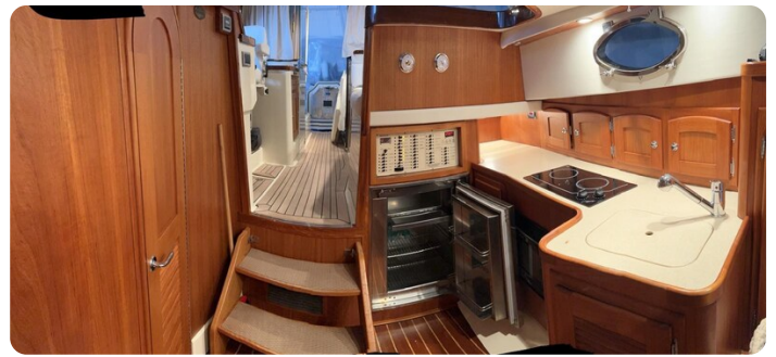
San Juan 40, galley