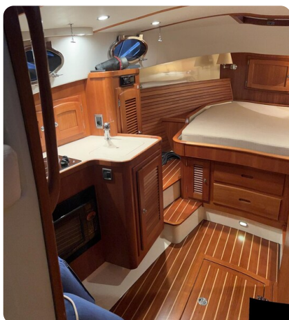
San Juan 40, lower deck