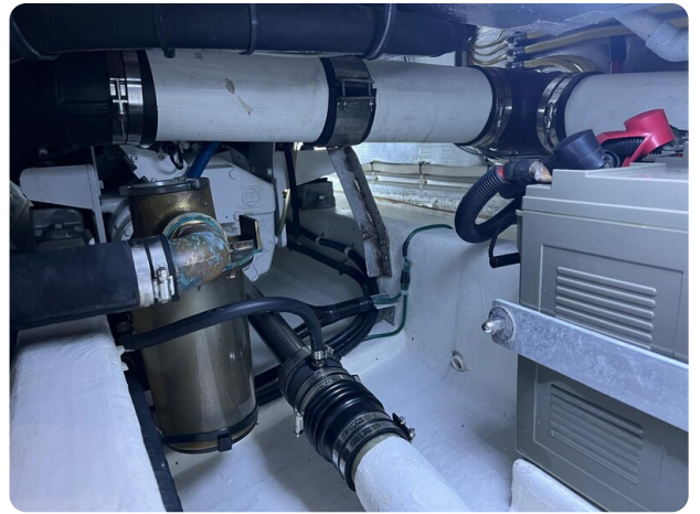
San Juan 40, engine room detail 2