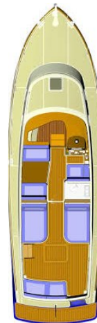
SAN JUAN 40 LAYOUT