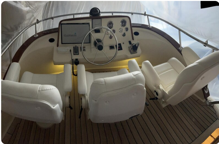
San Juan 40 Fly helm view