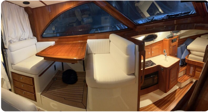
San Juan 40, dinette and galley