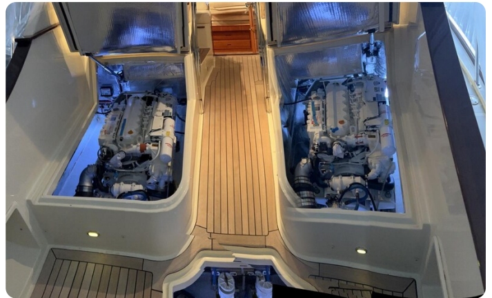
San Juan 40, engine room view