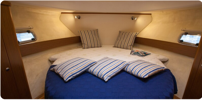
Saga 390 HT